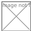
Диаграмма №1. Статистический анализ судебной практики Братского городского суда и Братского районного суда по компенсации морального вреда для физических лиц по различным категориям дел за период с 2009 по 2012 г.