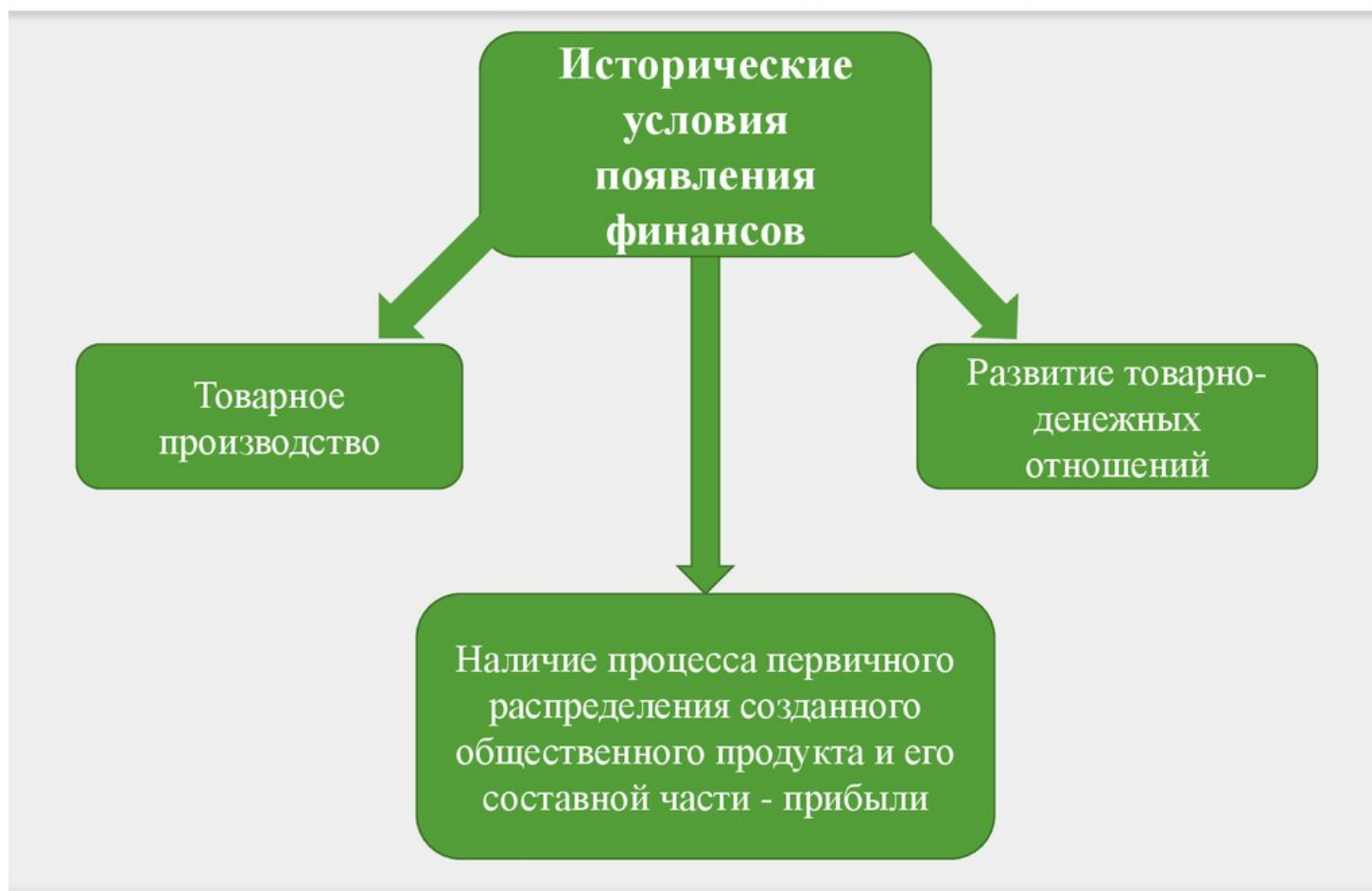
Рисунок 2 Возникновение и развитие финансов

Так как, несомненно, финансы являются исторической категорией (имеют стадии возникновения), то можно выделить 2 основных этапа развития финансов. Вначале – неразвитая форма финансов, когда основная масса денежных средств (2/3) расходовалась на военные цели, и финансы практически не оказывали воздействия на экономику. Другой характерной чертой этого периода была узость финансовой системы, так как она состояла из одного звена – бюджетного, и количество финансовых отношений было ограничено. Все они были связаны с формированием и применением бюджета. [6]