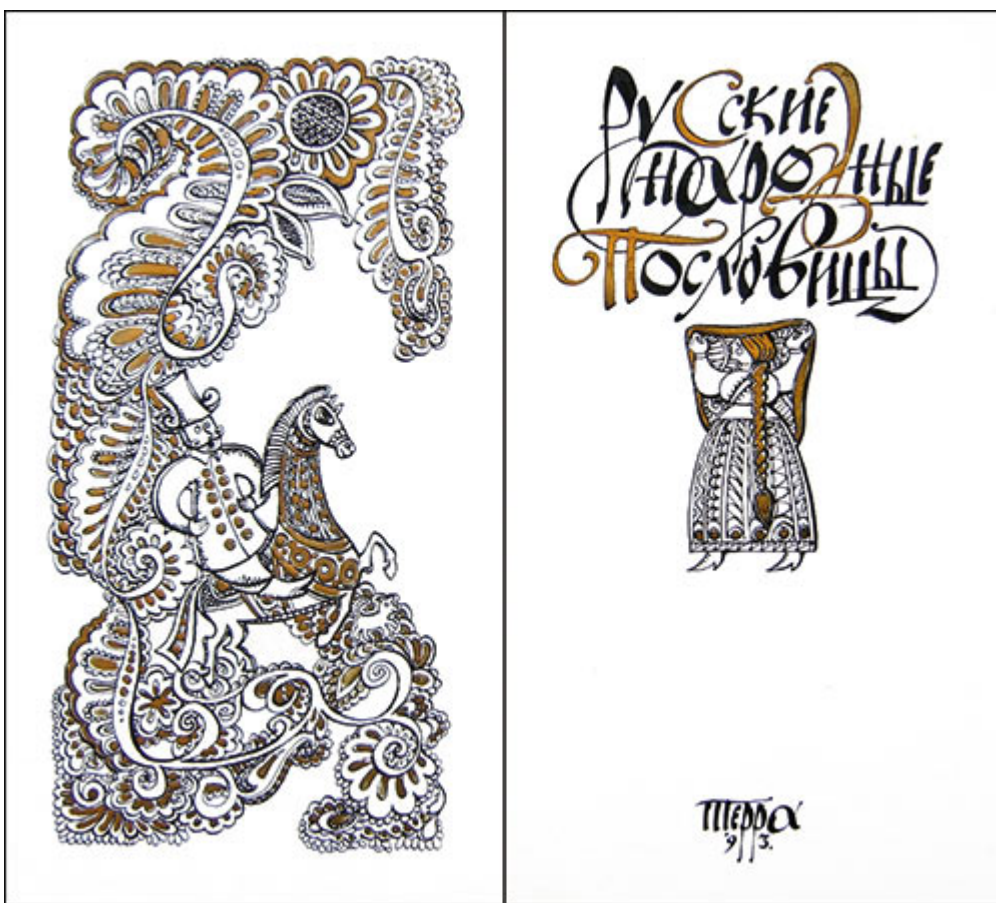
Рисунок 5. Двойной титул.

Двойной титульный лист занимает четыре страницы (два листа с оборотом) — рис. 5. Выходные сведения по-прежнему занимают одну страницу, на других страницах можно просторно и красиво расположить остальную информацию. В двойном титульном листе выделяют отдельные страницы в зависимости от информации, которая на них вынесена.