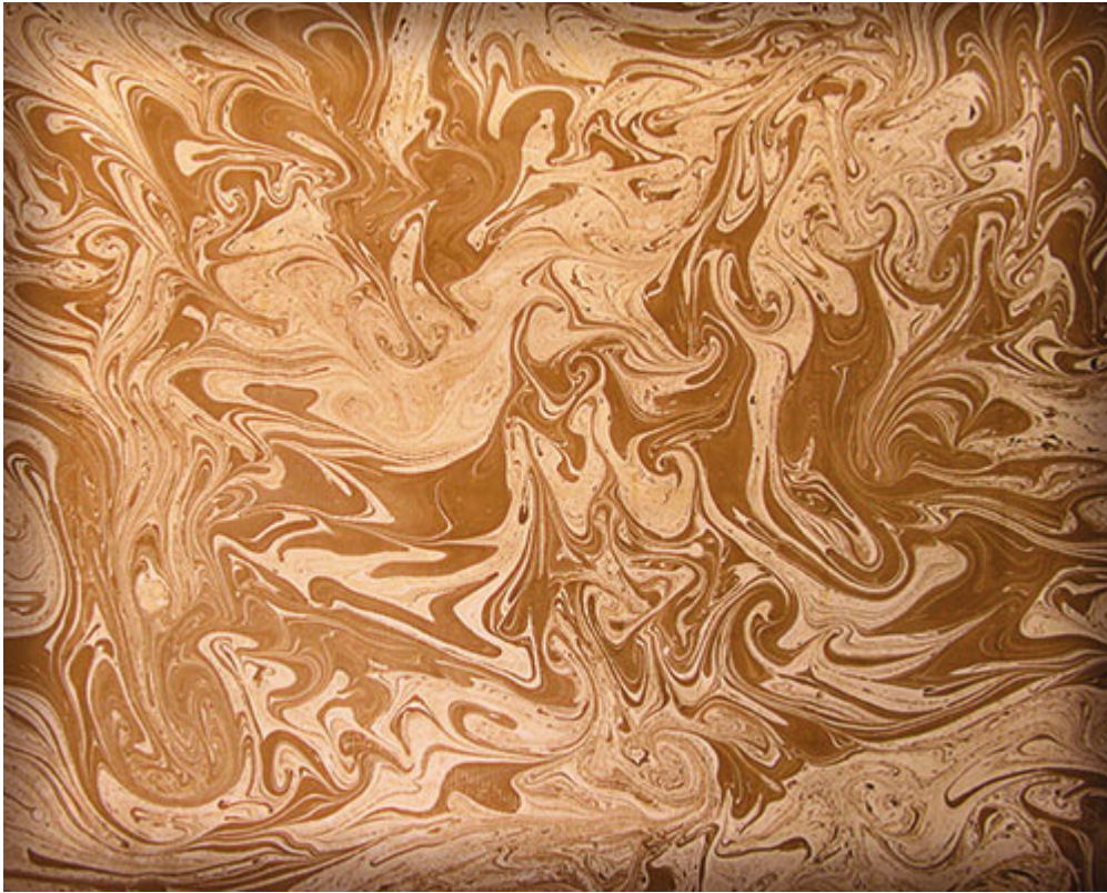
Рисунок 3. Форзац в стиле акватипии

Форзацы могут быть одноцветными и цветными, а также беспредметными или тематическими (рис. 3 и 4).