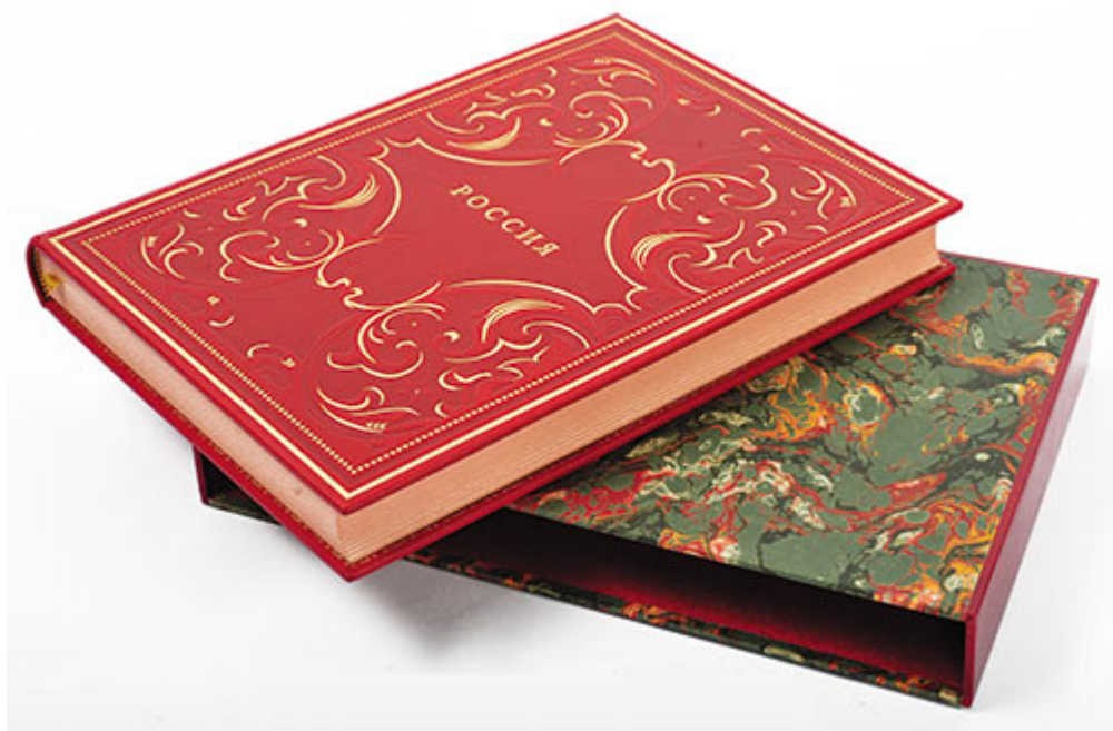
Рисунок 2. Переплет («дюшес», тиснение блинтовое и фольгой) и суперобложка

Для обеспечения сохранности оформления и повышения его привлекательности некоторые ценные издания (подарочные, сувенирные и пр.), независимо от того, есть на них суперобложка или нет, снабжают футляром.