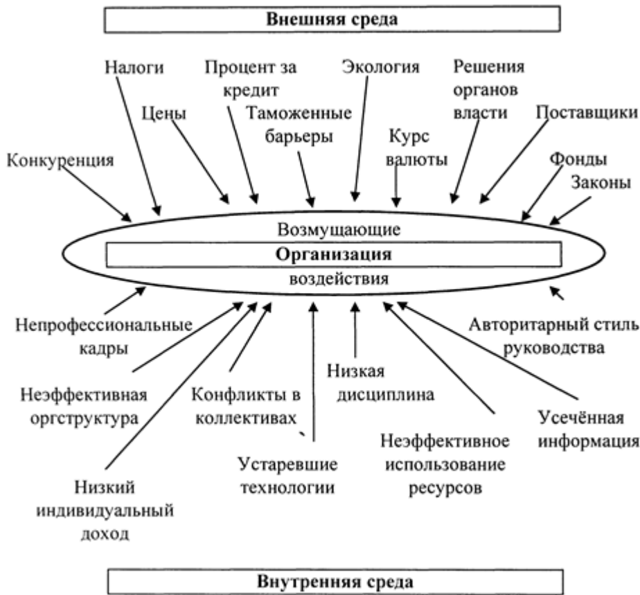
Рис. 1. Внешняя среда организации

Анализ внешней среды обычно считается исходным процессом стратегического управления, так как обеспечивает базу для определения как миссии и целей фирмы, так и для выработки стратегий поведения, позволяющих фирме выполнить миссию и достичь своих целей. Он представляет собой процесс, посредством которого разработчики стратегического плана контролируют внешние по отношению к организации факторы, чтобы определить возможные угрозы для фирмы. Анализ внешней среды служит инструментом, при помощи которого разработчики стратегии контролируют внешние по отношению к организации факторы с целью предвидеть потенциальные угрозы и вновь открывающиеся возможности. Анализ внешнего окружения помогает получить важные результаты. Он дает организации время для прогнозирования возможностей, время для составления плана на случай непредвиденных обстоятельств, время для разработки системы раннего предупреждения на случай возможных угроз и время на разработку стратегий, которые могут превратить прежние угрозы в разного рода выгодные возможности.