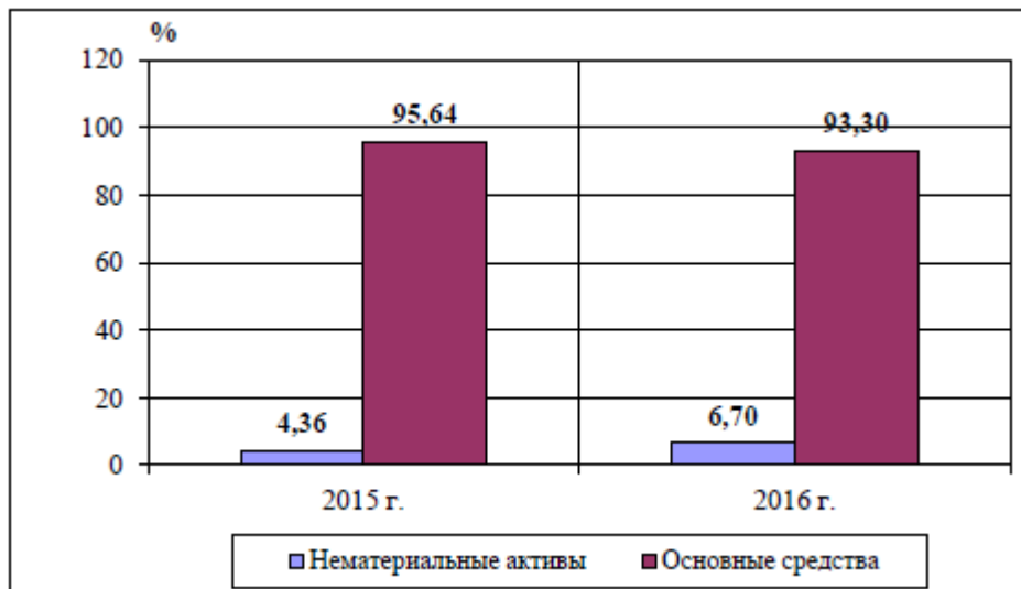
Рис. 2. - Динамика структуры внеоборотных средств

В Торговом доме «Светоч» нематериальными активами являются товарные знаки и знаки обслуживания, деловая репутация и иные нематериальные активы (в частности, некоторые затраты).