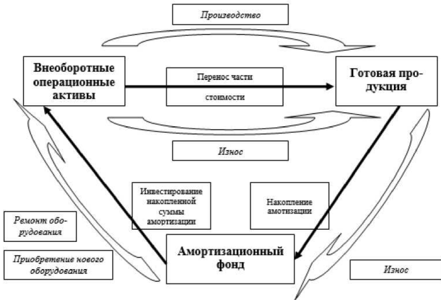
Рис. 1.2 - Кругооборот внеоборотных активов

Внеоборотные активы находятся в постоянном кругообороте на предприятии. Представим его на рис. 1.2.