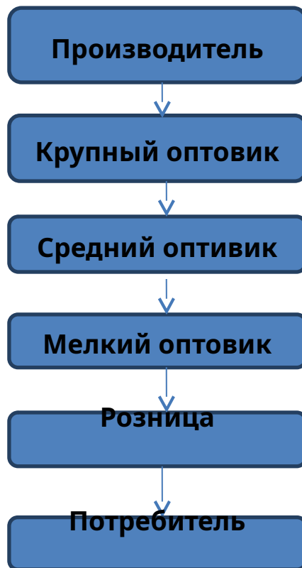
Рисунок 1 – Классический метод доведения товара до потребителя

При классическом методе все просто: производитель произвел товар и назначил цену. В нее входит себестоимость товара и свою прибыль. Далее товар от производителя через сеть оптовиков (крупные, средние, мелкие), где также происходит увеличение цены (транспортные, складские, административные расходы + прибыль), ведь не один человек не будет работать бесплатно, а уж тем более себе в убыток. Так товар поступает в розничную сеть. Здесь, как правило, наценка посolidнее – оборот меньше, затрат больше. Таким образом, пока товар попадет от производителя к конечному потребителю, стоимость товара увеличивается в разы, а в некоторых случаях в десятки раз [16, с. 54].