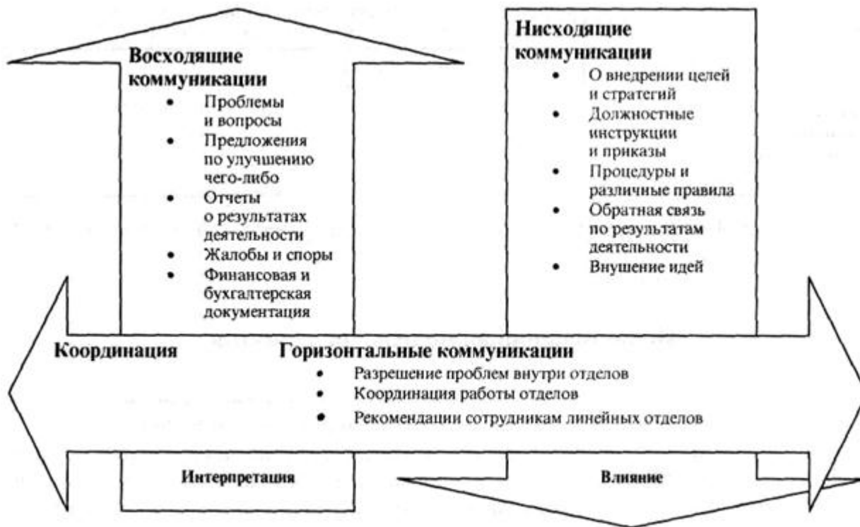
Рис. 2. Содержание вертикальных и горизонтальной коммуникаций [10, с. 25]

Своевременность функционирования любого элемента коммуникаций в организации стоит в первых рядах влияния на производственный процесс. Но любая информация, циркулирующая внутри того или иного информационного потока, несет определенную значимость в необходимом для соответственной операции время. То есть, одна и та же информация может быть актуальна или нет в разное время операционных действий производственного процесса.