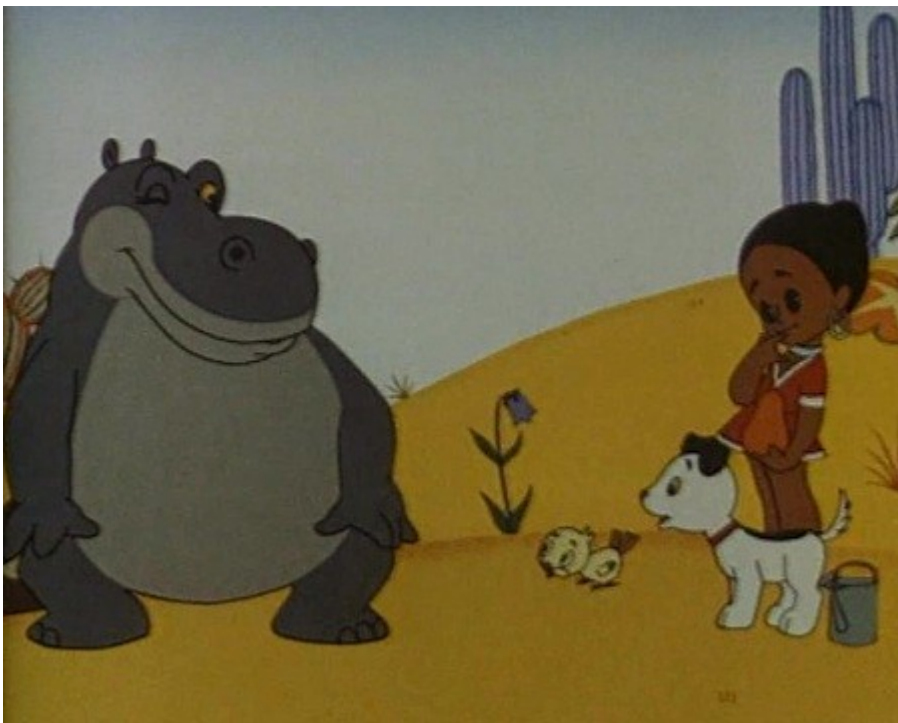
Рис. 3. Фрагмент из мультфильма «Самый большой друг»