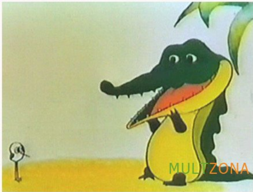
Рис. 4 Фрагмент из мультфильма «Птичка Тари»