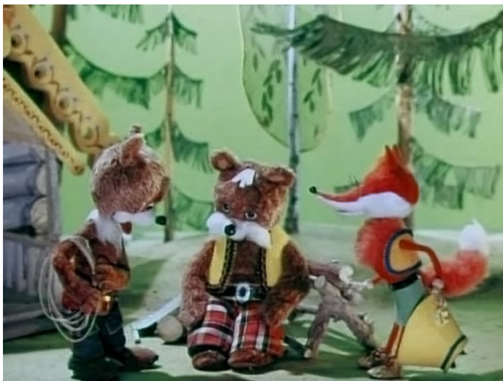
Рис.1 Фрагмент из мультфильма «Волшебный мешочек»