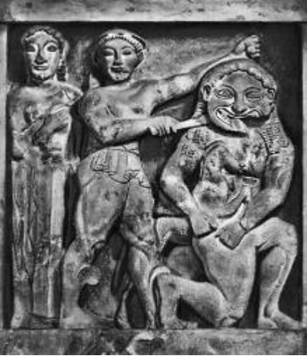
Рис. 2 - Метопы из храма в Селинунте. 2-я половина 6 в.