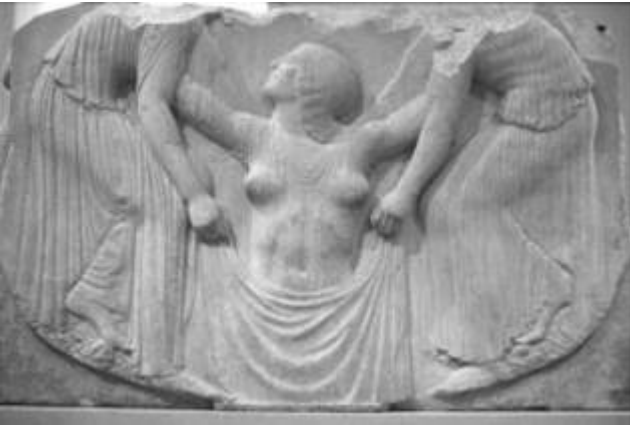
Рис. 3 - Рельеф алтаря богини Афродиты