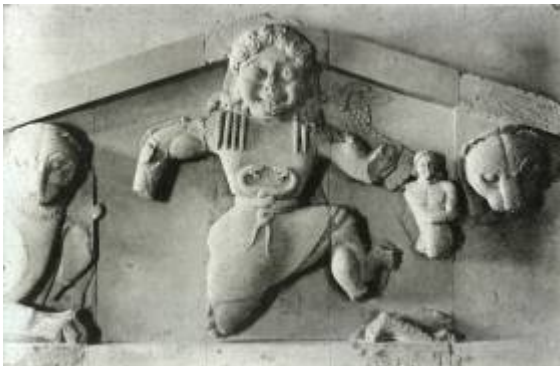
Рис. 1- Фронтон храма Артемиды

Опираясь на исследование, которое я провела, могу сделать вывод, что большинство древнегреческих скульптур - как легендарных участников семи чудес света, так и рядовых изваяний - были созданы на почве древних мифов, что несомненно повлияло на развитие как этой, так остальных сфер искусства. Античные боги были идеалом физического и духовного равновесия. Греки стремились создать физический след божеств в статуях и скульптурах. Эти статуи служили в качестве заместителя бога на земле, которому молились, приносили жертвы, у ног которого просили защиты и утешения в религии. Именно с развитием идеи материализации мысли и развивалась доминирующая роль скульптуры среди иных сфер античного искусства. Именно поэтому искусство скульптуры с расцветом всей греческой цивилизации занимает главенствующее положение.