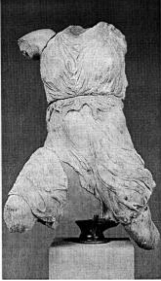
Рис. 5- Фидий. Торс богини с западного фронтона Парфенона