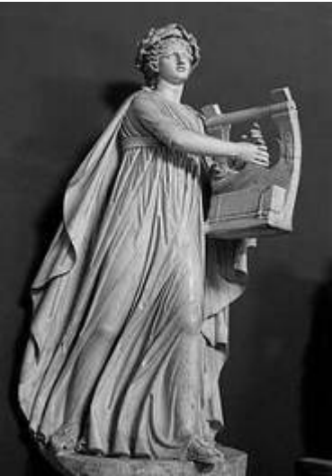
Рис. 4 - Статуя Аполлона с кифарой