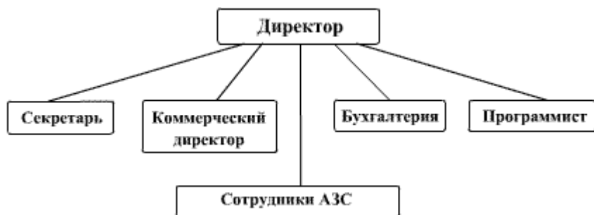
Рис.1 Организационная структура АЗС ТНК

АЗС расположена по адресу: г. Тула, ул. Рязанская, 5а. В общей сложности АЗС является небольшой организацией, соответственно ей требуется минимальное количество сотрудников, так же задачу упрощает то, что организация является индивидуальным предпринимательством, что сразу значительно урезает количество «лишних» сотрудников. Организационная структура представлена на рисунке 1.