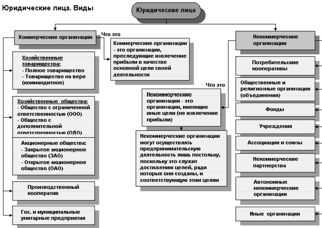
Рисунок 1.2 Классификация юридических лиц по ГК РФ