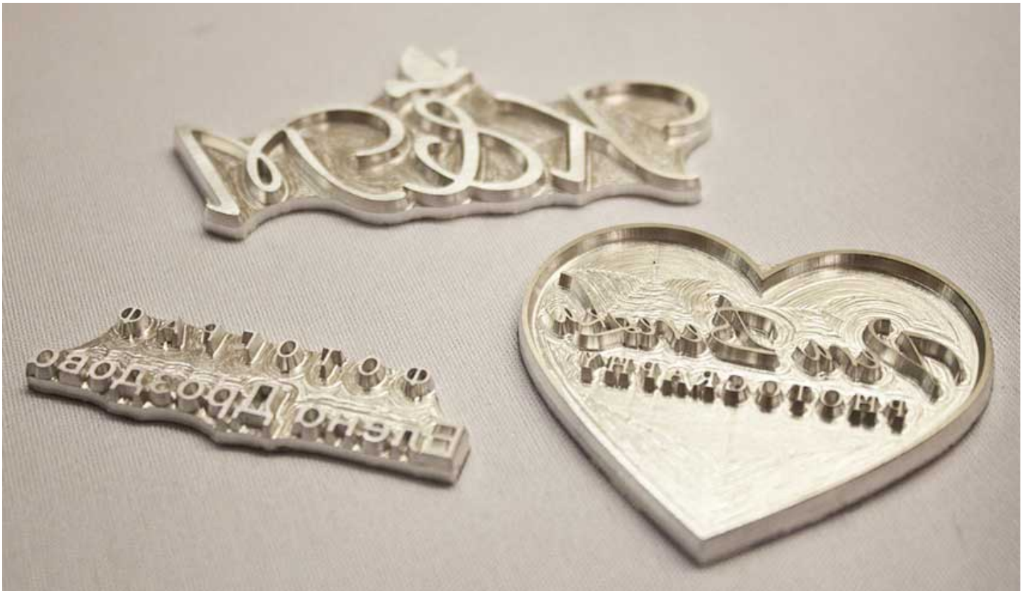
Рис. 16. Специальный штамп для горячего тиснения

Холодное тиснение (см. рис. 17). Структура фольги должна включать в себя слой с клеем, разрушающимся под действием УФ-излучения (для горячего метода применяется клей, уничтожающийся нагреванием). Холодный способ подразумевает использование: