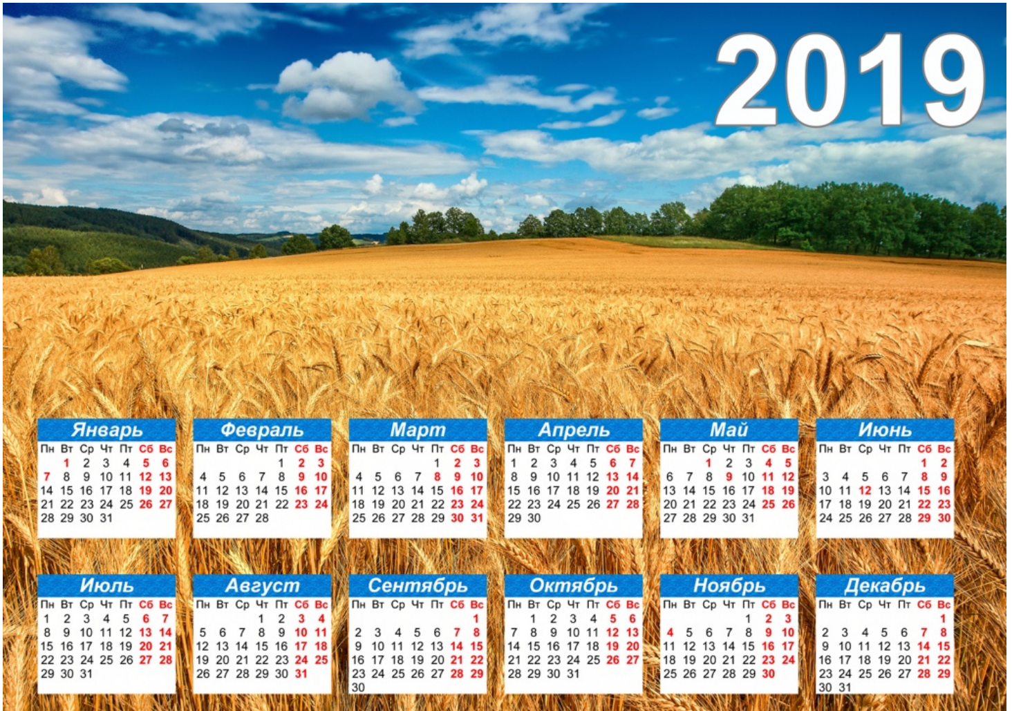
Рис. 6. Календарь