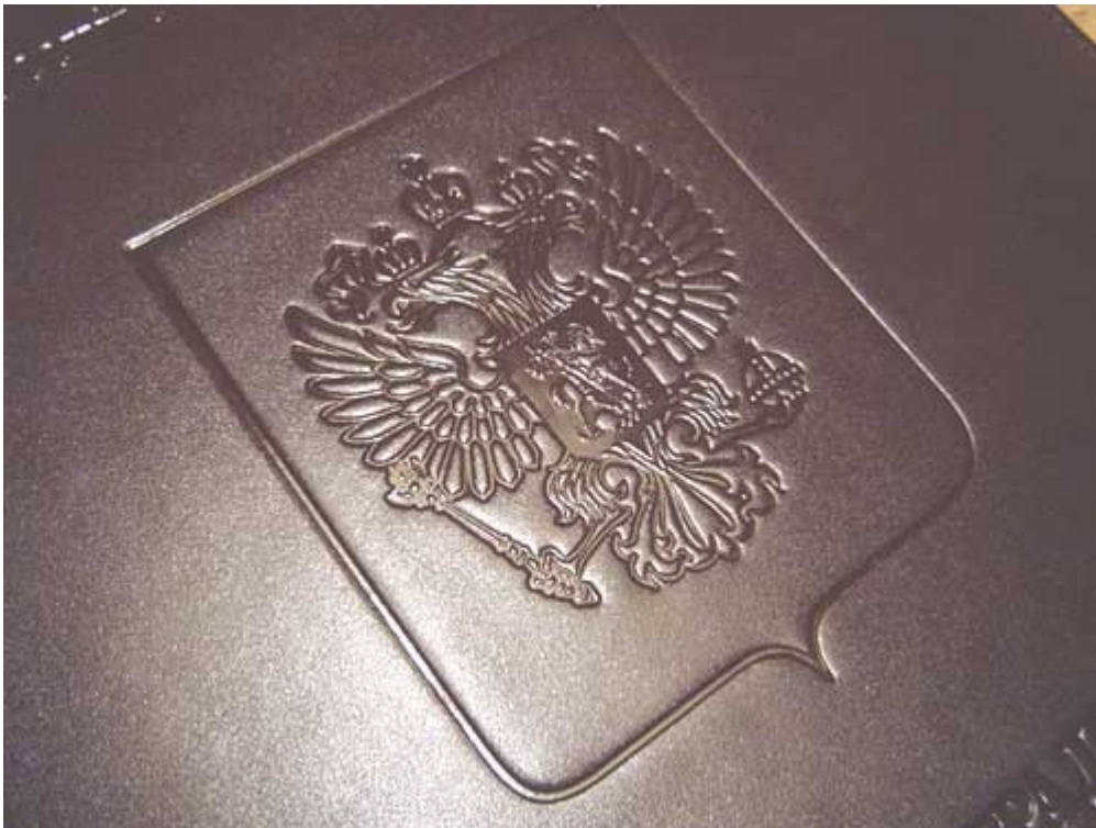
Рис. 18. Блинтовое тиснение