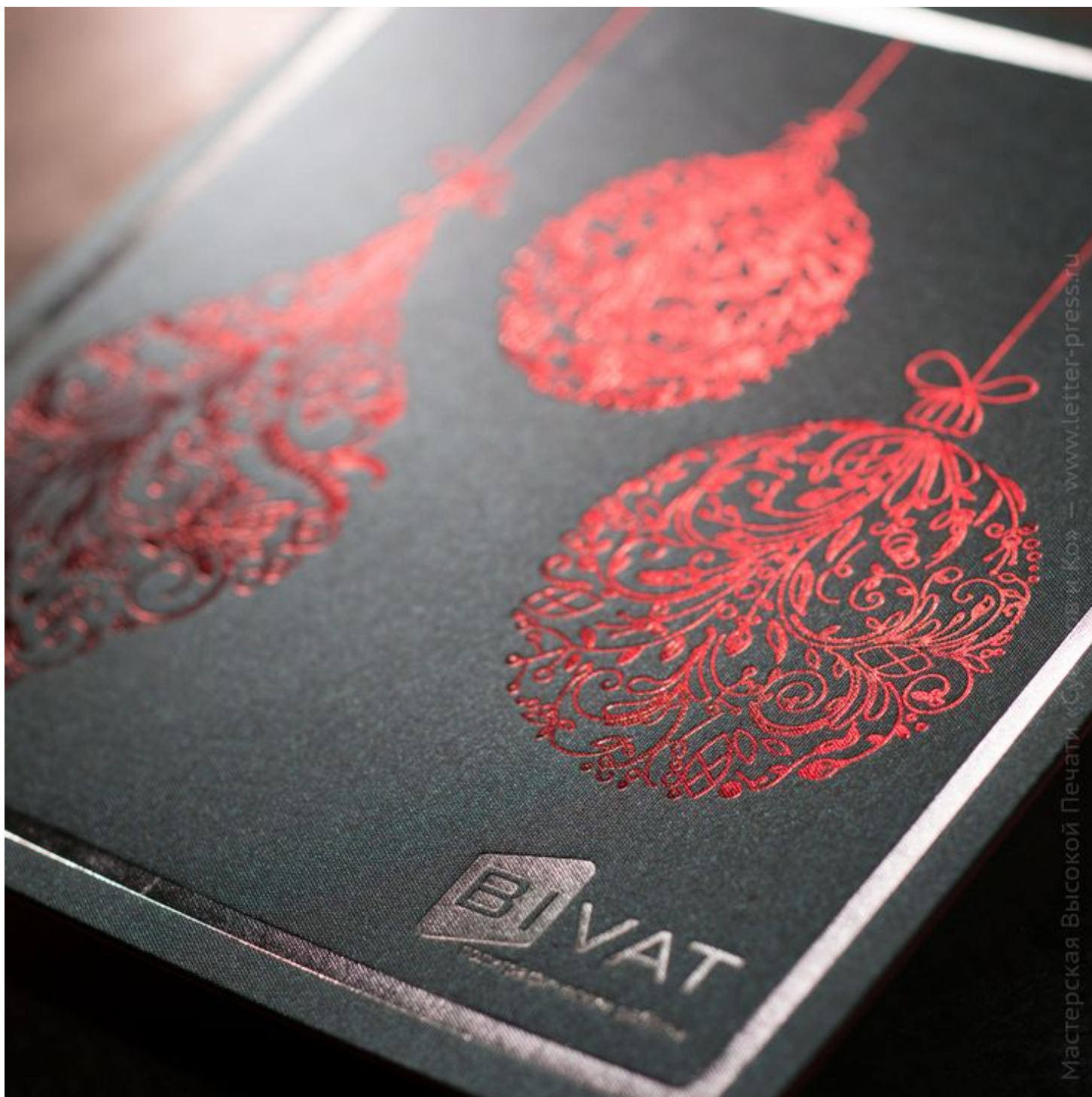
Рис. 15. Тиснение пигментной фольгой