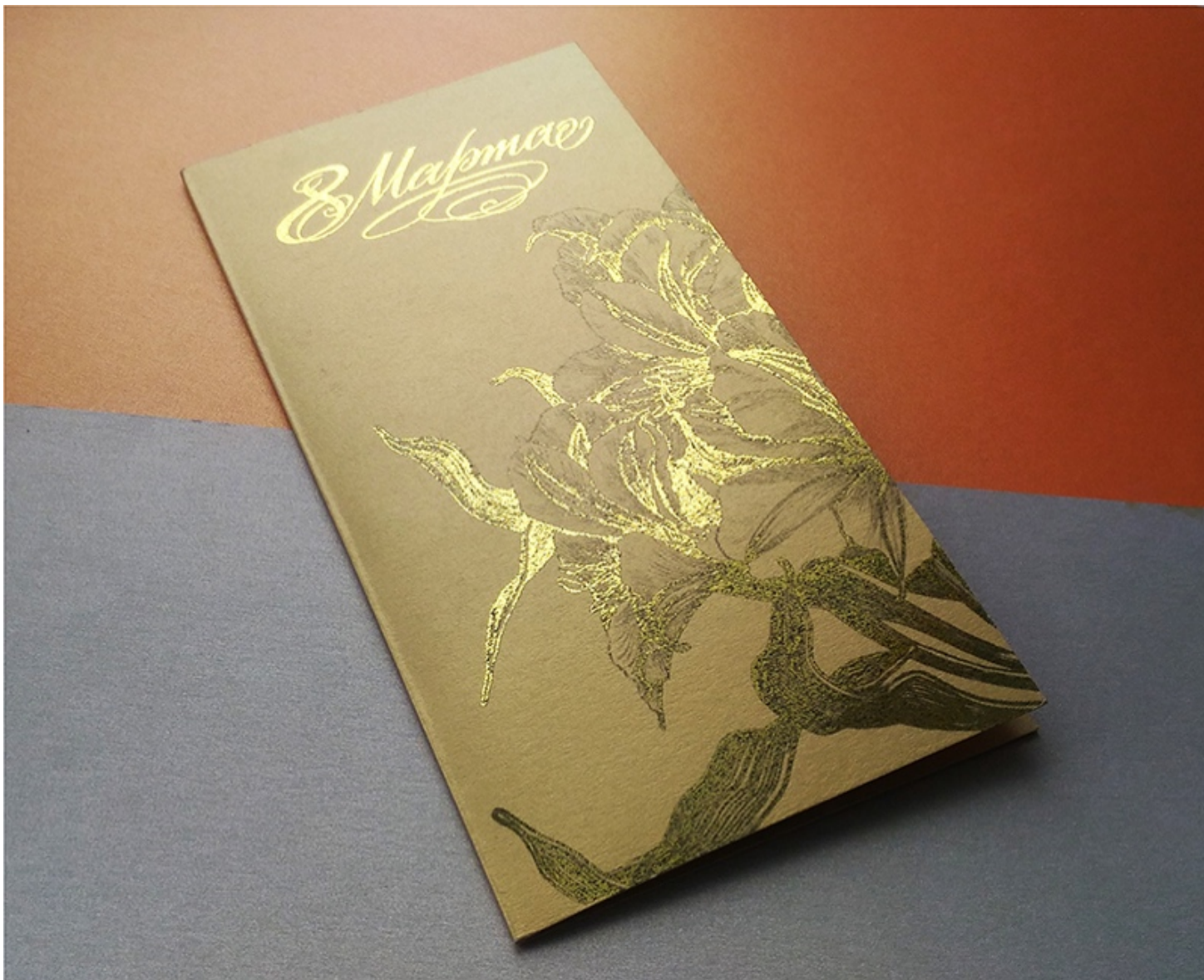
Рис. 17. Холодное тиснение фольгой

Рассмотренные виды тиснения позволяют решить множество дизайнерских задач с помощью подбора фольги разных расцветок и текстур, представленной в огромном ассортименте. Для наилучшего результата необходимо учесть несколько факторов: