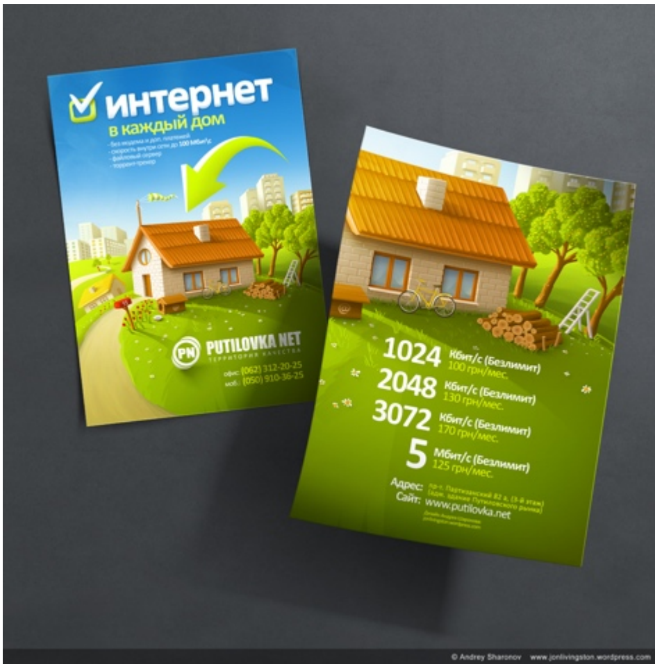
Рис. 3. Листовка