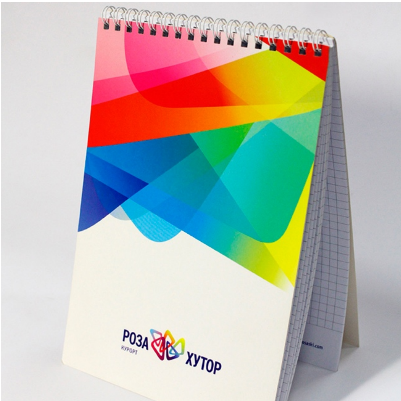
Рис. 9. Блокнот