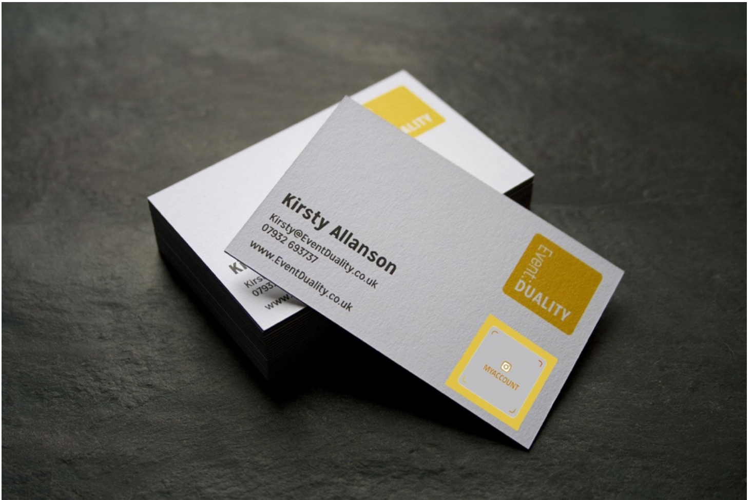
Рис. 7. Визитная карточка