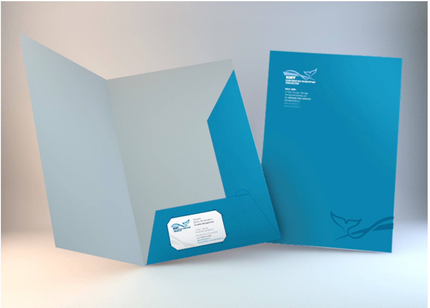
Рис. 8. Папка