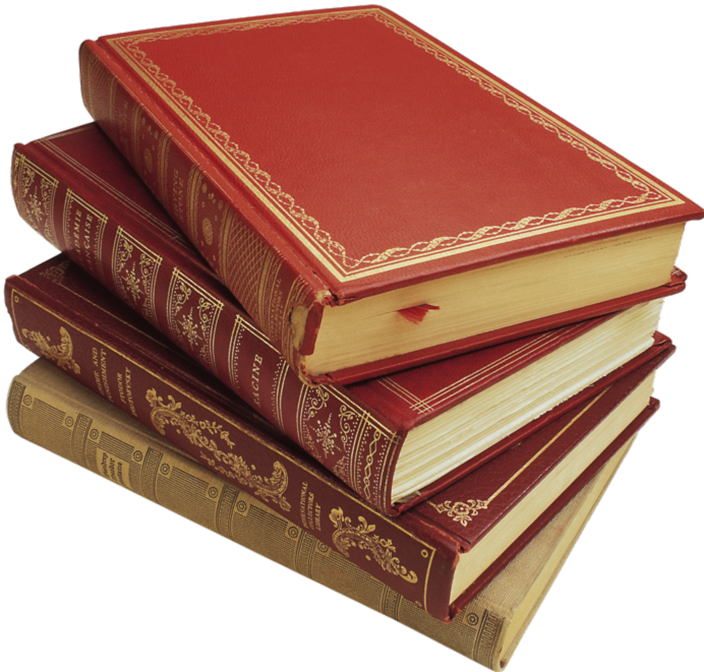
Рис. 13. Книга

Непериодическое издание, объемом более 48 страниц в мягком (скрепленное термобиндером) либо твердом переплете (прошито ниткой).