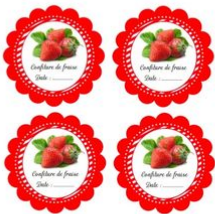
Рис. 11. Этикетка