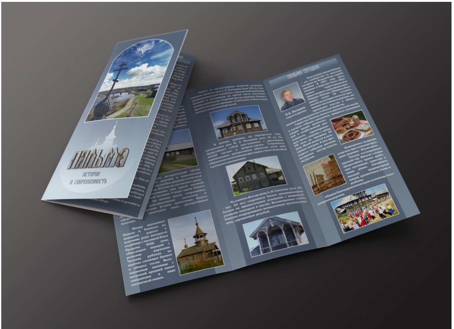
Рис. 4. Буклет