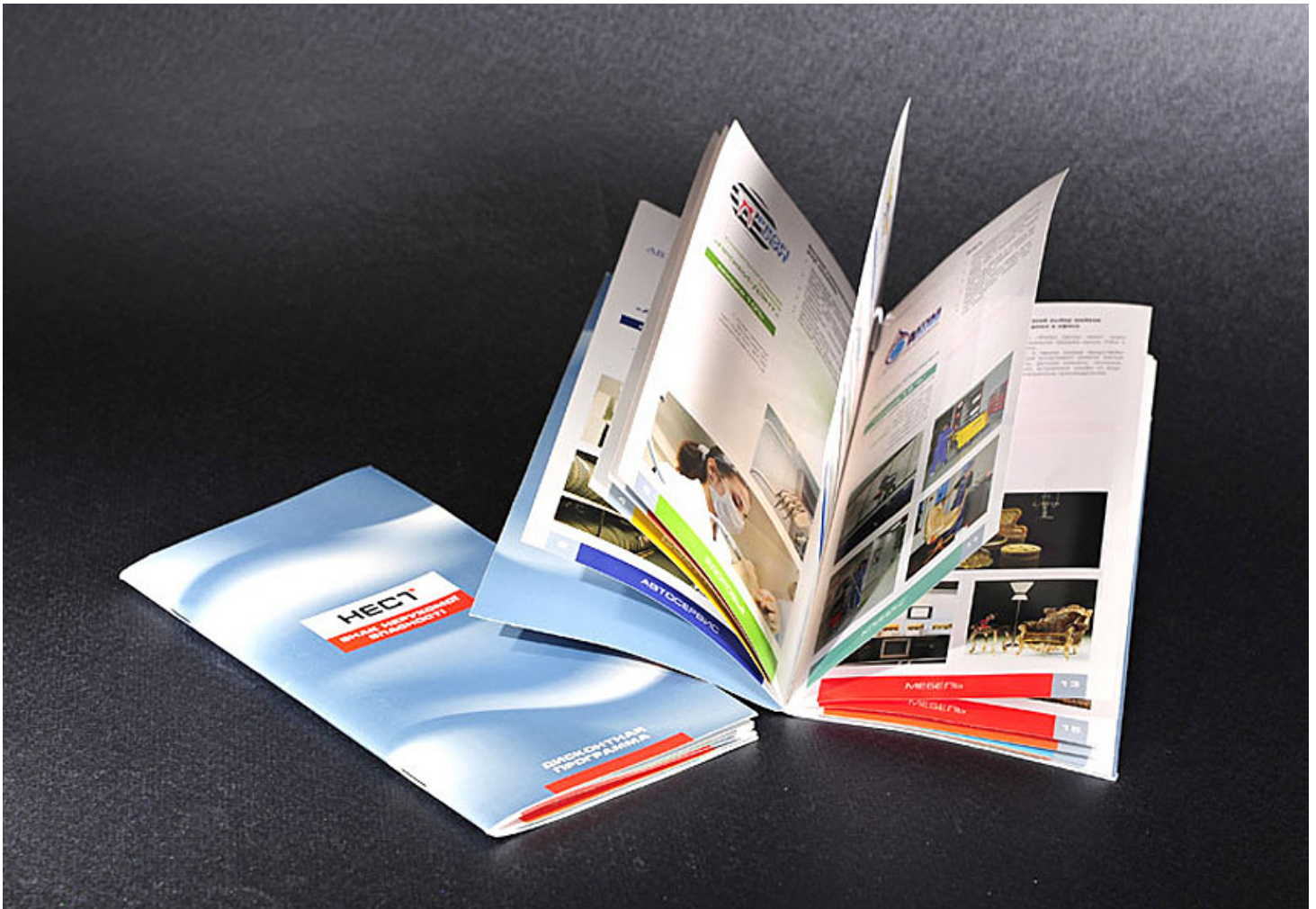
Рис. 5. Брошюра