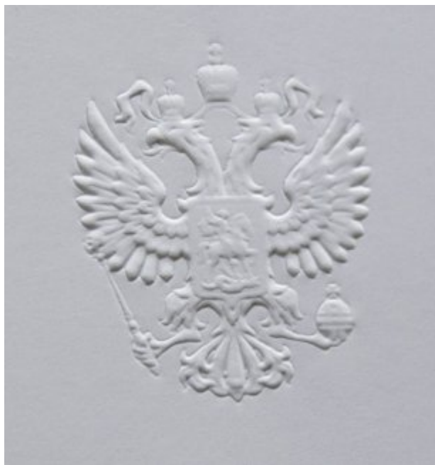
Рис. 19. Конгревное тиснение

Конгревное тиснение позволяет создать неповторимый дизайн, ведь объемные иллюстрации выделяют вещь из массы обыденных предметов. Кроме того, получаемое данным способом изображение имеет ряд преимуществ.