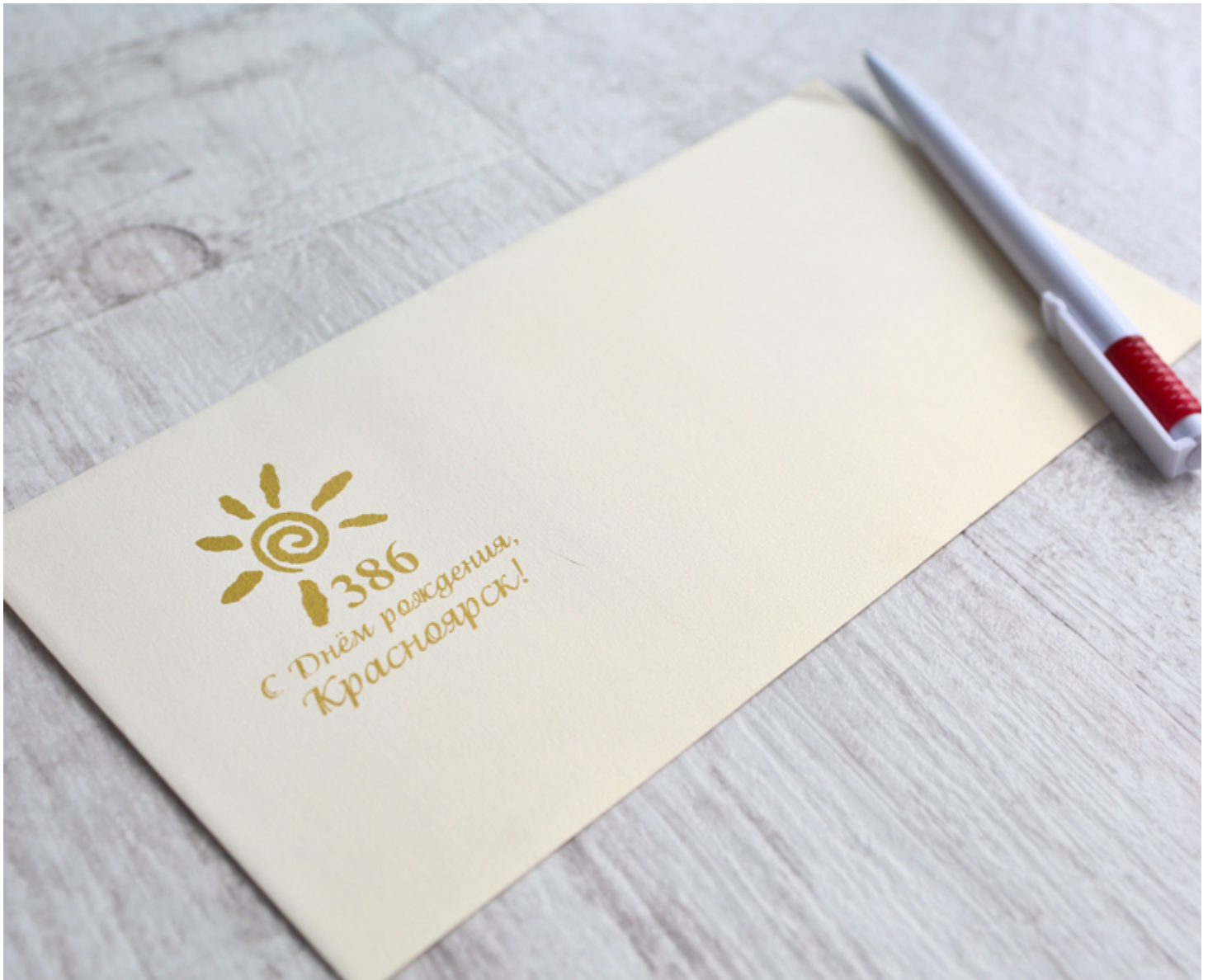
Рис. 10. Конверт