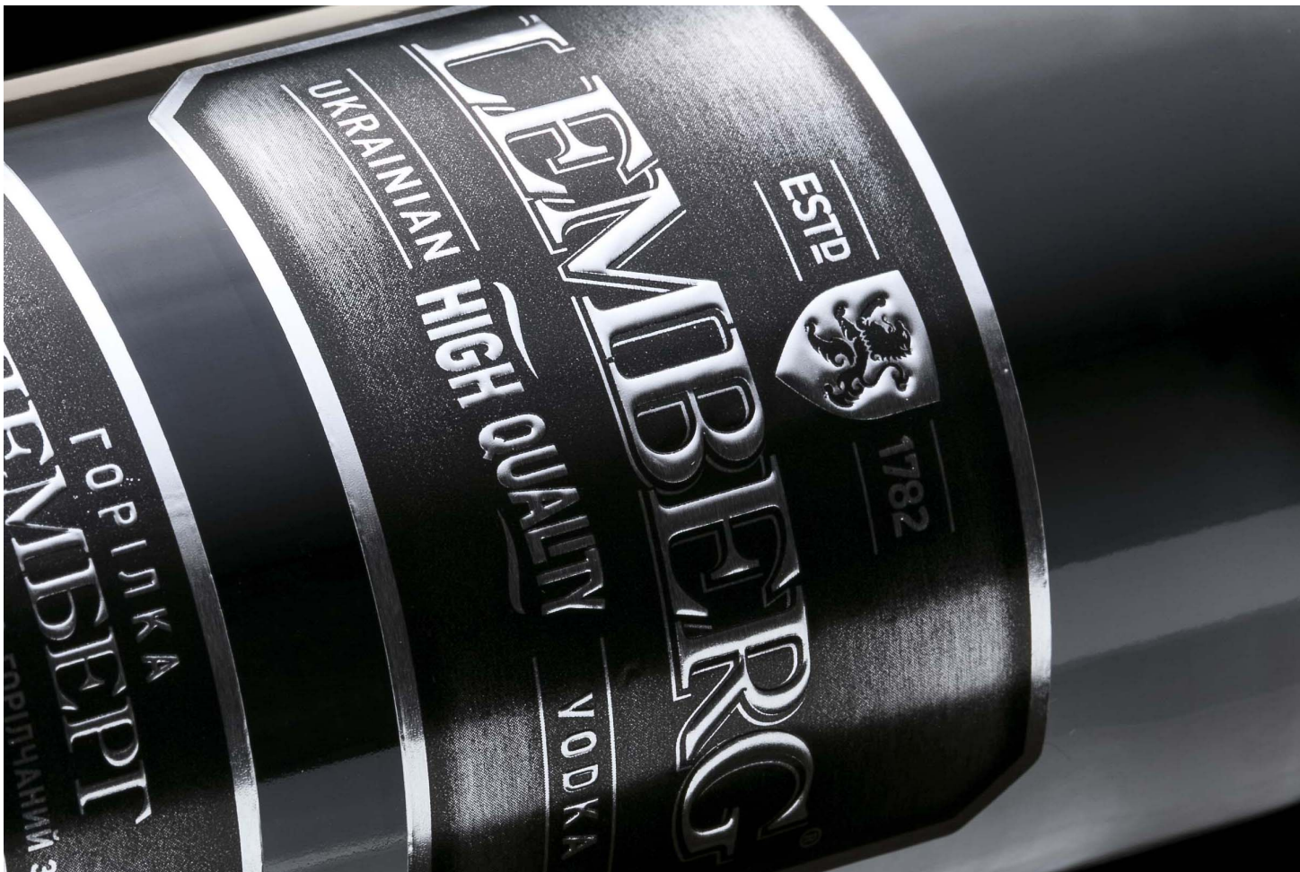
(рис. 2 — тиснение металлизированной (серебряной) фольгой на этикетке)