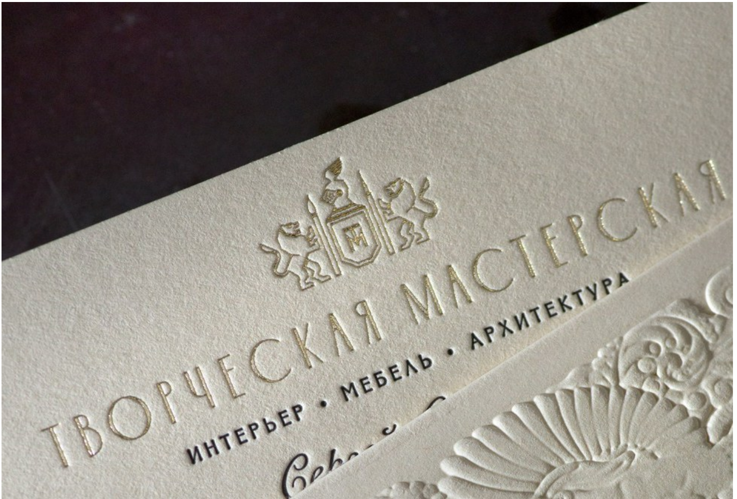
(рис. 3 — конгревное тиснение металлизированной (золотой) фольгой на визитке)