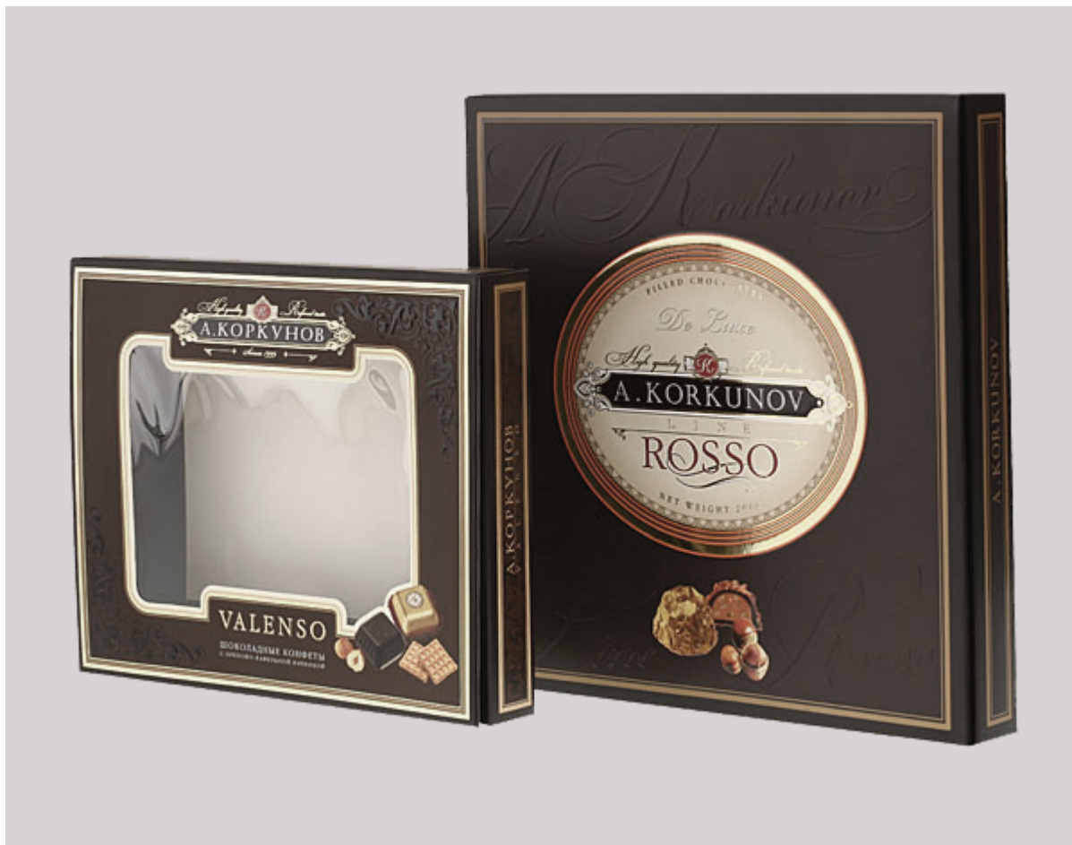
(рис. 1 — тиснение металлизированной (серебряной) фольгой на упаковке)

Хороший пример — редизайн коробки конфет «Коркунов», в которой теперь используется тиснение металлизированной (золотой) фольгой, что говорит о премиум классе данного продукта.