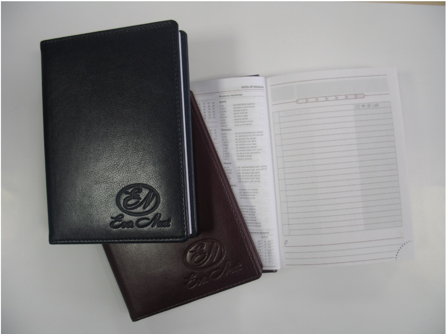
(рис. 4 — блинтовое тиснение на кожаных ежедневниках)