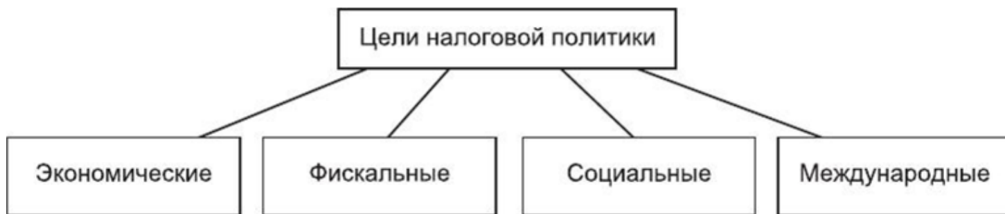
Рисунок 7 – Цели налоговой политики