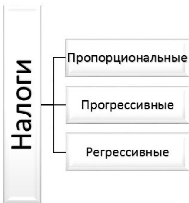
Рисунок 4 – Виды налоговых систем

Представим на рисунке 4 виды налоговых систем (пропорциональные, прогрессивные и регрессивные).