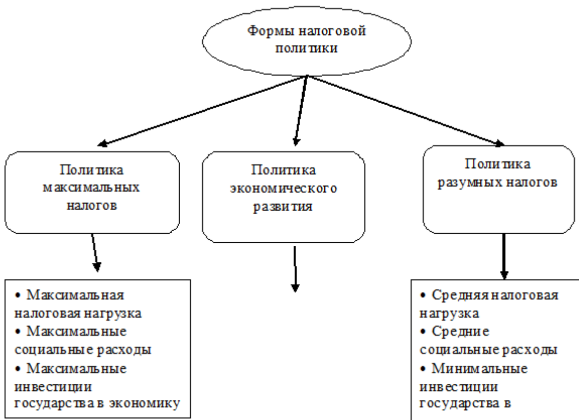
Рисунок 6 – Формы налоговой политики

Рассмотрим первую форму - политику максимальных налогов. «В этом случае государство устанавливает наиболее высокие налоговые ставки, сокращает налоговые льготы и вводит значительное число налогов, получая от своих граждан предельное количество финансовых ресурсов, не очень волнуясь о различных последствиях. Конечно, такой метод налоговой политики не оставляет каждому налогоплательщику и обществу в целом почти никаких надежд на экономическое развитие. Следовательно данная форма политики проводится государством, в основном, в исключительные моменты его развития, например, экономический кризис или война. Аналогичная налоговая политика проводилась в России с возникновения экономических реформ, с первого дня введения налоговой системы в 1992 г.» [3, С.46].