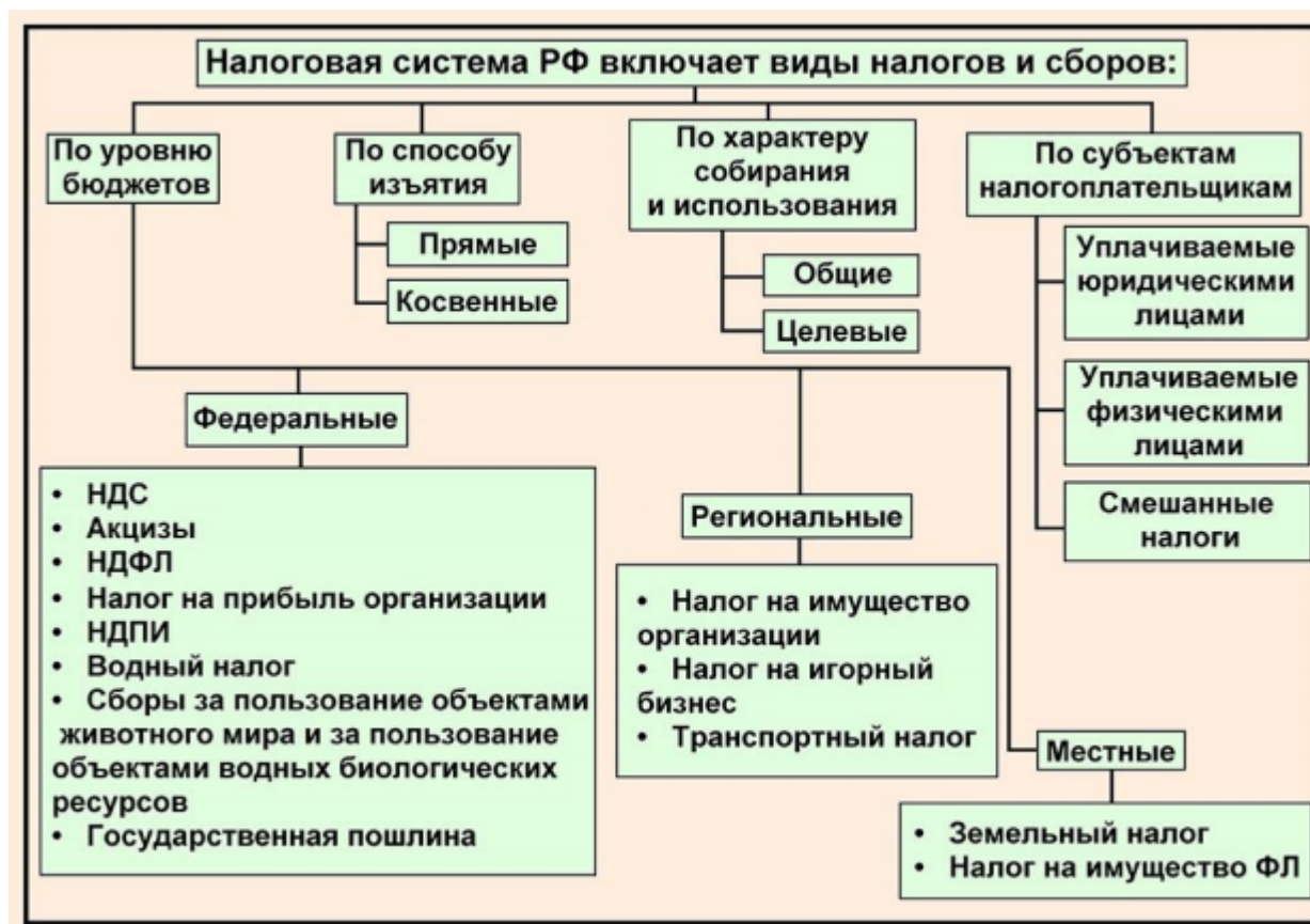
Рисунок 2 – Отнесение налогов РФ к конкретному уровню управления

В зависимости от метода взимания налоги делятся на прямые и косвенные. Эта классификация наиболее историческая и традиционно известная.