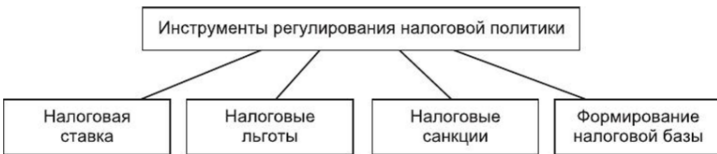
Рисунок 5 – Инструменты регулирования налоговой политики

Основные инструменты регулирования налоговой политики приведены на рисунке 5.