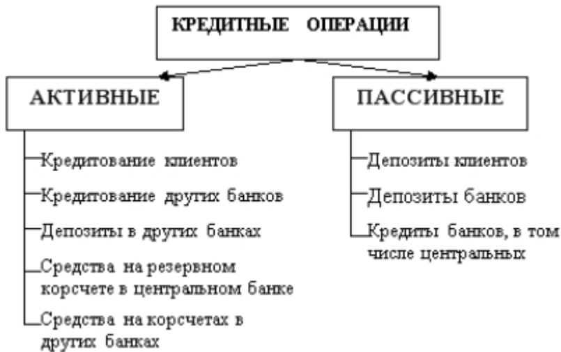
Рисунок 1 - Классификация банковских кредитных операций