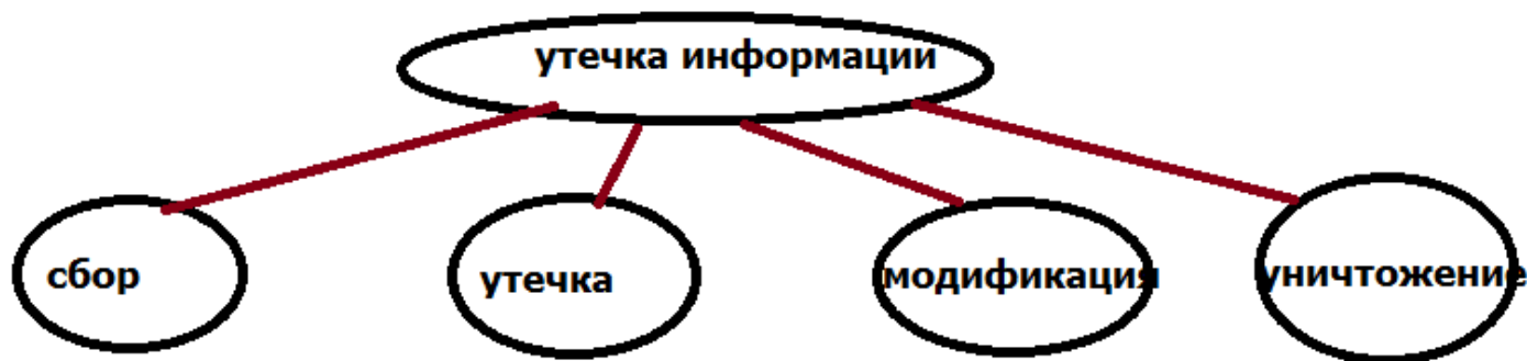
Рисунок 2. Виды угроз информационной безопасности

У угрозы информационной безопасности всегда есть источники. Рассмотрим их.