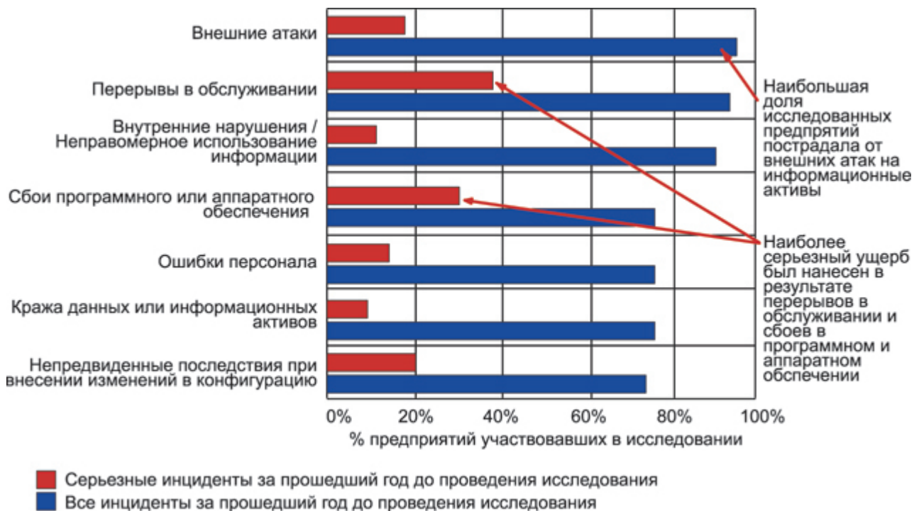
Рисунок 3. Угрозы безопасности