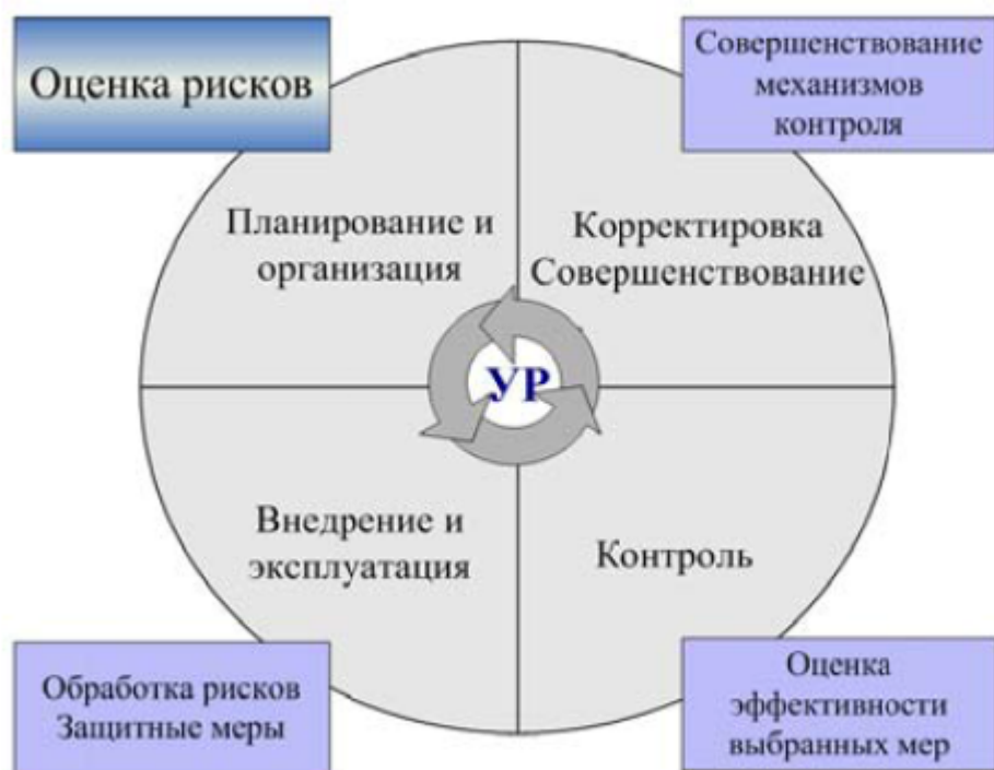
Рисунок 2. Управление рисками ИБ

При анализе рисков, ожидаемый ущерб, в случае реализации угроз, сравнивается с затратами на меры и средства защиты, после чего принимается решение в отношении оцениваемого риска, который может быть: