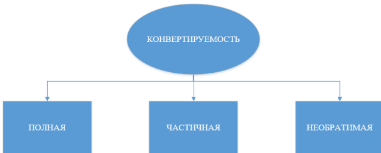
Рисунок 1 – Режимы конвертируемости валют

В зависимости от допускаемой свободы выбора и действий для участников внешнеэкономического оборота существует четкая разновидность режима обратимости (рис. 1).