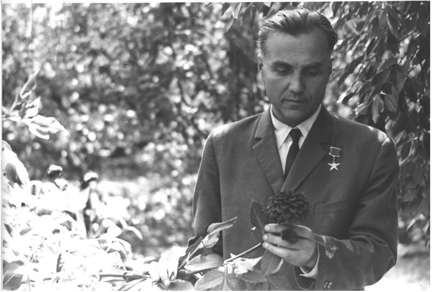
Василий Сухомлинский в Павлыше