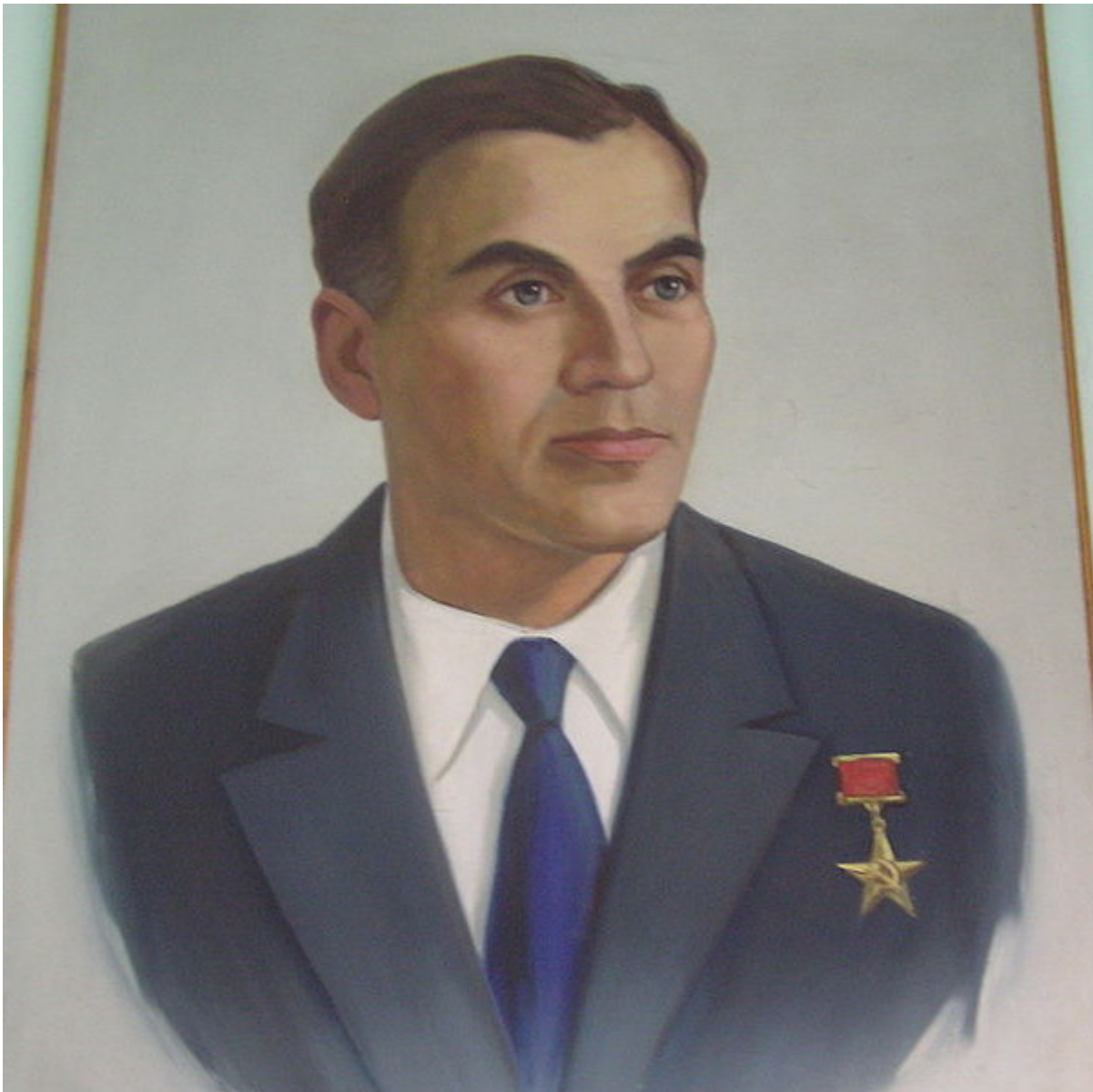
Василий Александрович Сухомлинский