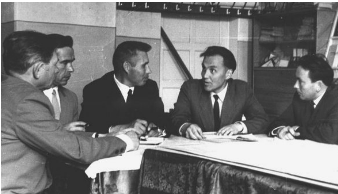
Василий Сухомлинский (второй справа) с коллегами