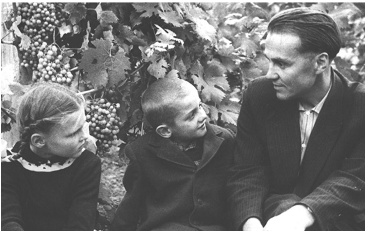
Василий Сухомлинский с детьми