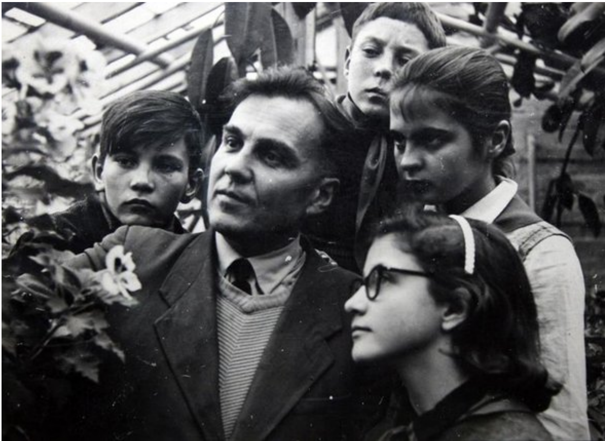
Василий Сухомлинский на экскурсии с детьми