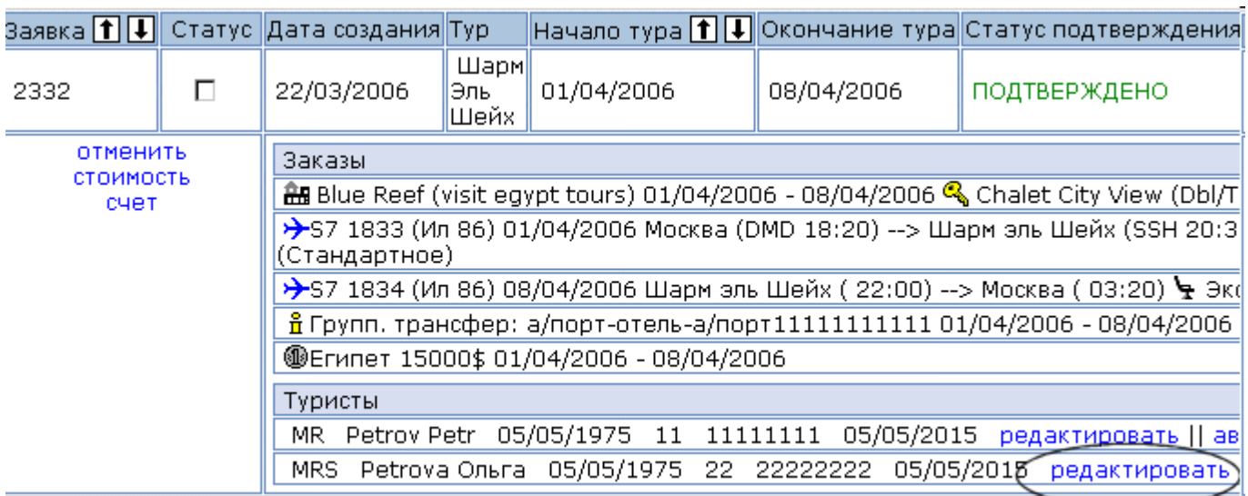
Рис. 8. Просмотр существующих заявок

Этот модуль позволяет редактировать такие данные туристов как: «Фамилия», «Имя», «Отчество», «Паспортные данные» (см. рис.). При сохранении изменений в СамоТур в «систему сообщений» отправляется сообщение. Все изменения попадают в историю заявки. В справочнике «заявки» данная заявка помечается красным цветом.