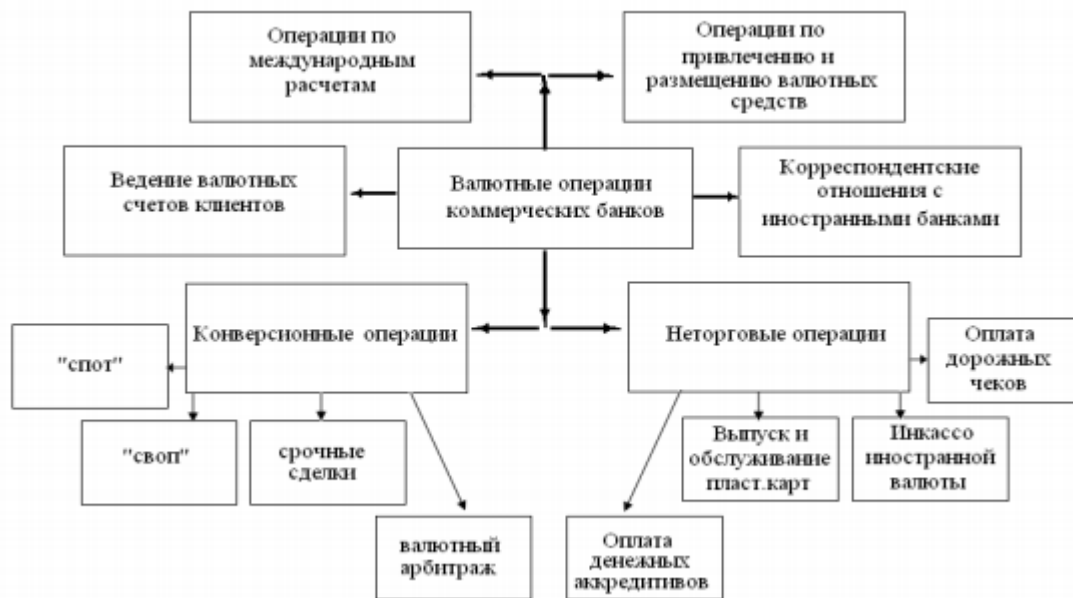
Рисунок 2 – Классификация валютных операций

Валютные операции банков классифицируются по следующим критериям: