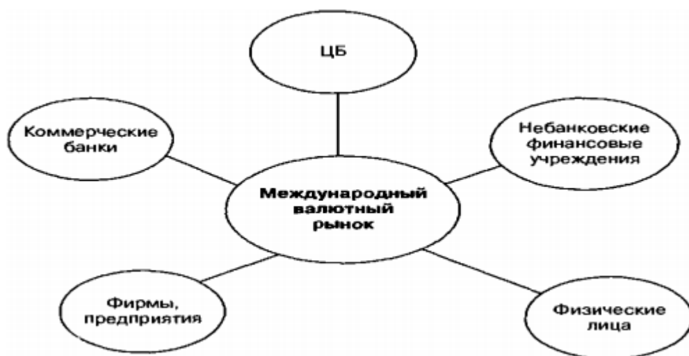
Рисунок 1 – Участники валютного рынка

При проведении определенных форм валютной политики, будь то девизная или дисконтная, центральные банки устанавливают правила, и условия торговли валютой интервенции центрального банка сравнительно редки и применяются для устранения беспорядочных колебаний валютного курса.