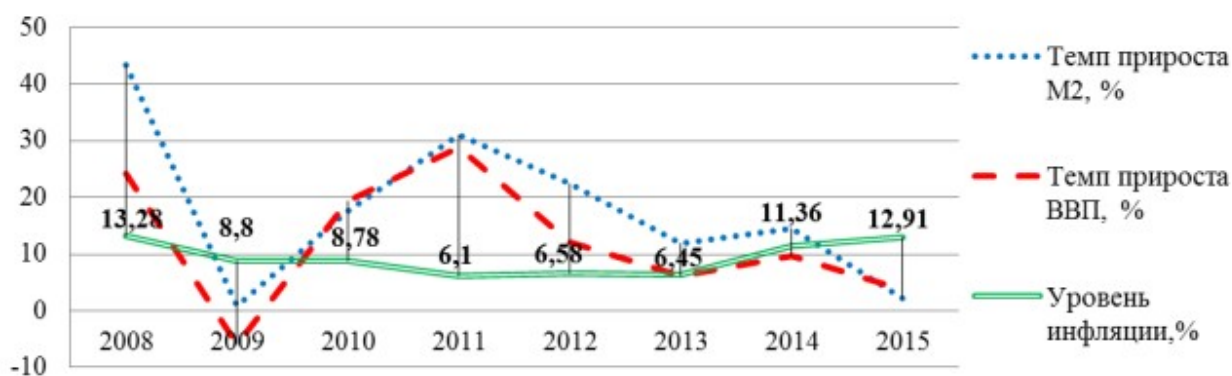
рисунок 1 - Изменение важнейших показателей экономики РФ в 2008–2014

Итак, попробуем проанализировать Изменение важнейших показателей экономики РФ в 2008–2014 (рисунок 1) гг.