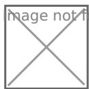
Рисунок 2 - Взятие ребёнком на себя роли у дошкольников

Таким образом, результаты эксперимента показывают, что в старшей группе выражен средний уровень взятия ребёнком на себя роли (67%).