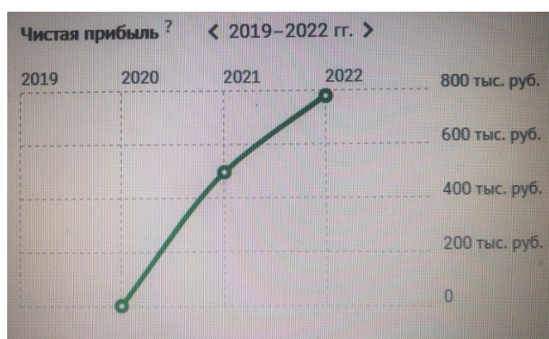
Рисунок 3 – прибыль организации ООО « АвтоЛайфНск» за 2021 и 2022г.

На рисунке 3 представлена чистая прибыль организации :