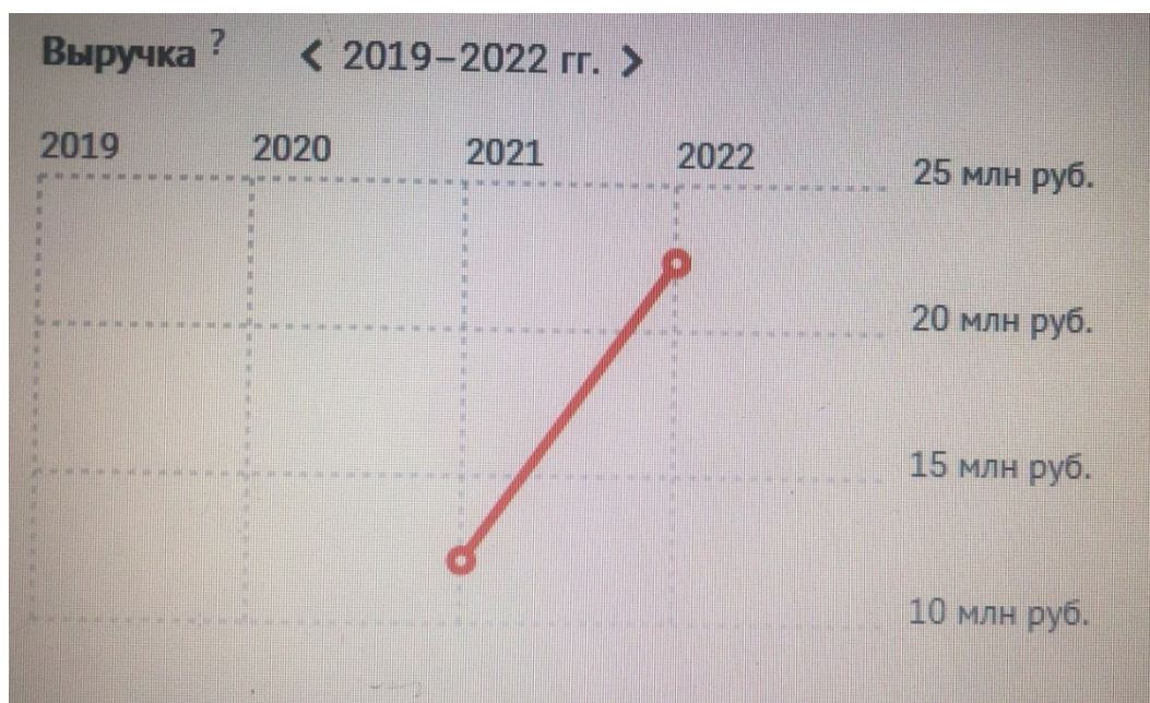
Рисунок 2 – выручка за 2021, 2022 год ,организации ООО «АвтоЛайфНск»

По рисунки 2 видно , что компания начинала со стартового капитала .