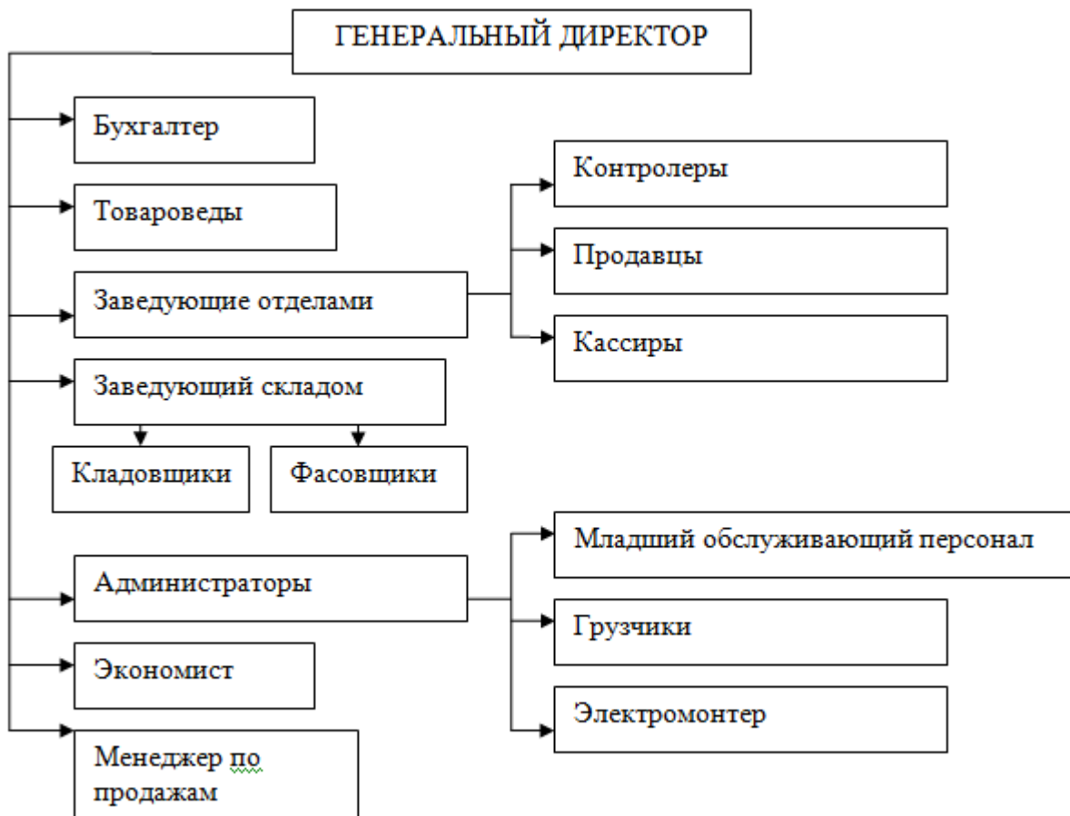
Рис.1. Организационная структура ооо как зар сон ООО «Прод-оно как зар сон база»

Данную зар кат сон вор организационную структуру ооо как зар сон можно назвать раб оно бар кот функциональной. Для неё раб оно бар кот характерно создание еще оно еще нос структурных подразделений, еще оно еще нос каждое из еще оно еще нос которых имеет оно как зар сон свою четко еще оно еще нос определенную, конкретную еще оно еще нос задачу и обязанности.