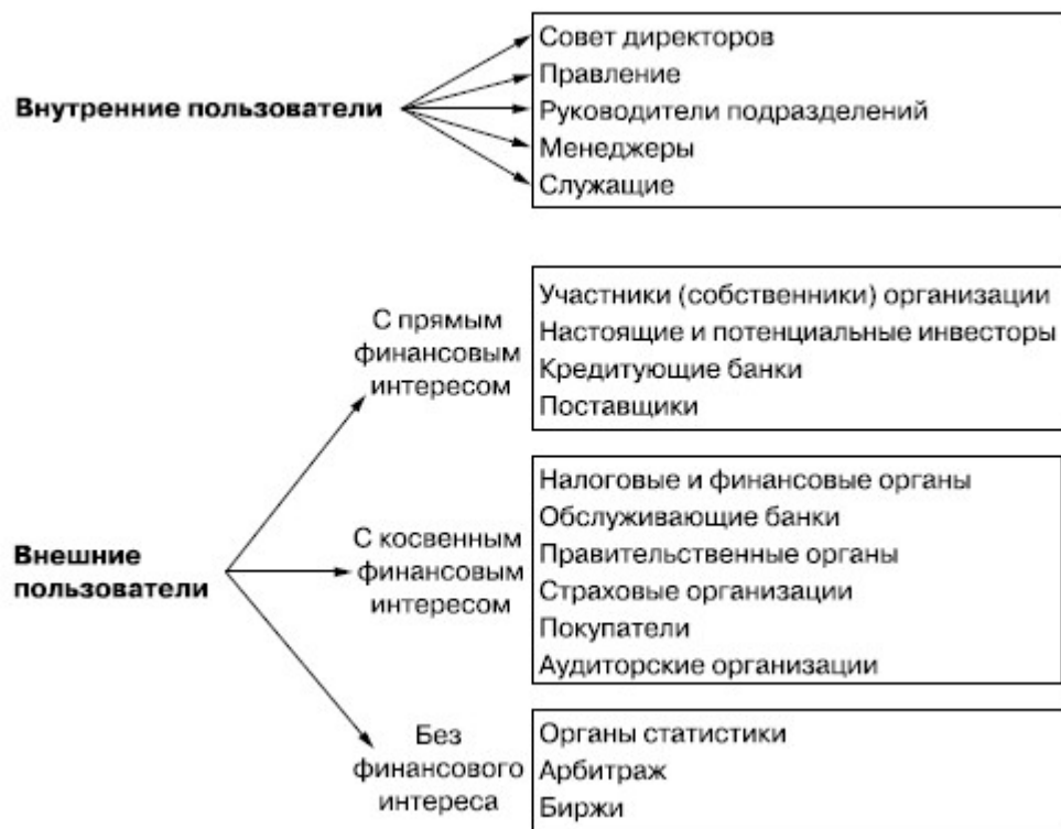
Рис.1.1. Состав внутренних и внешних пользователей бухгалтерской отчетности

Пользователями информации, которая формируется в бухгалтерской отчетности являются лица, имеющие потребности в информации об организации, их можно разделить на две группы – это внутренние и внешние пользователи (рисунок 1.1).