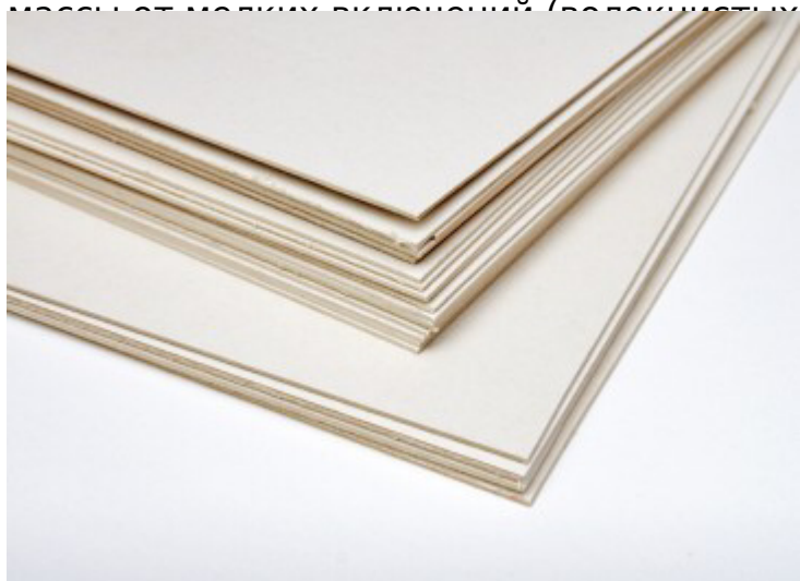
Процесс листоформирования картона

Готовая к изготовлению картона масса поступает в напорный ящик машины делающей картон с дополнительно введёнными минеральными включениями, проходит через узлоуловитель, на котором и производится уже последняя очистка массы от мелких включений (не волокнистых). Затем на машине происходит следующее обезвоживание и сушка.