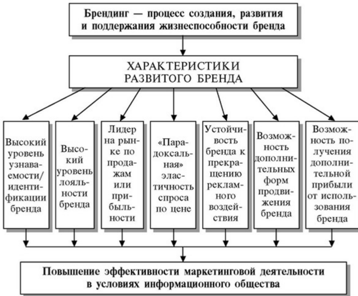
Рис.1.3. «Общая схема развитого бренда на предприятии»