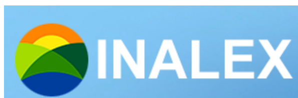
Рис. 3.3. Бренд туристической компании «ИНАЛЕКС»

Бренд данной компании представлен такими составляющими/визуальными элементами: название компании прописными буквами белого цвета на английском