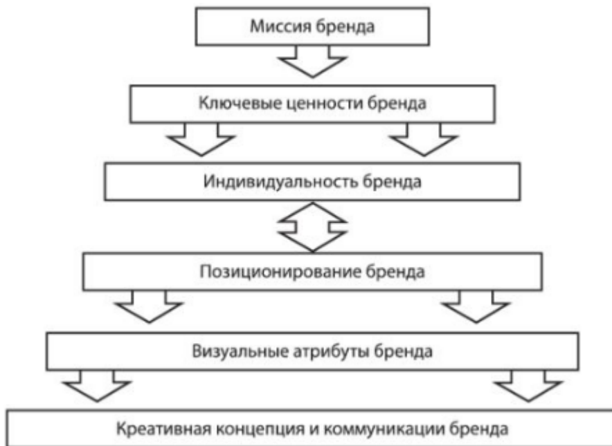
Рис. 1.2. «Концепция бренда»