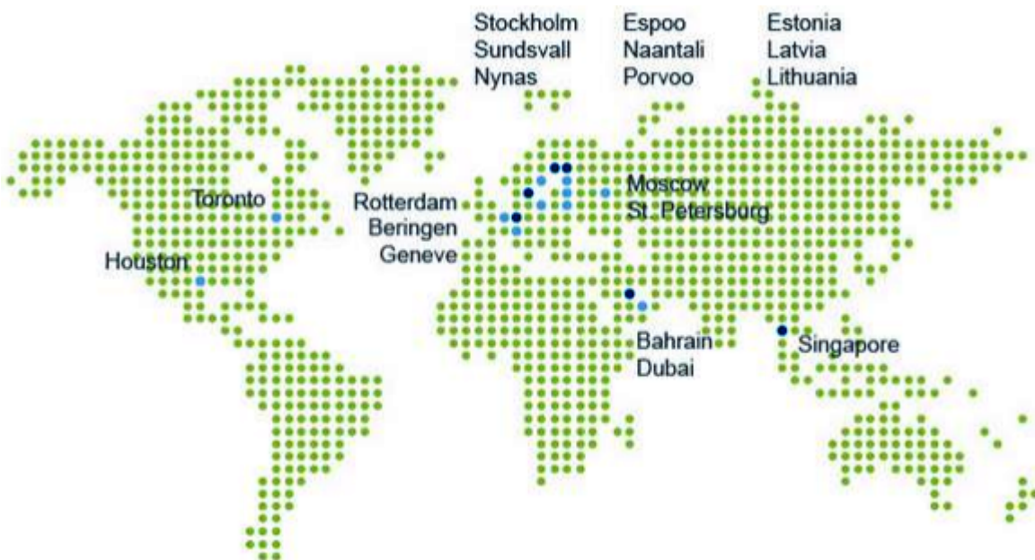
Рис. 1. Регионы присутствия компании Neste

На рисунке 1 приведены регионы присутствия компании.