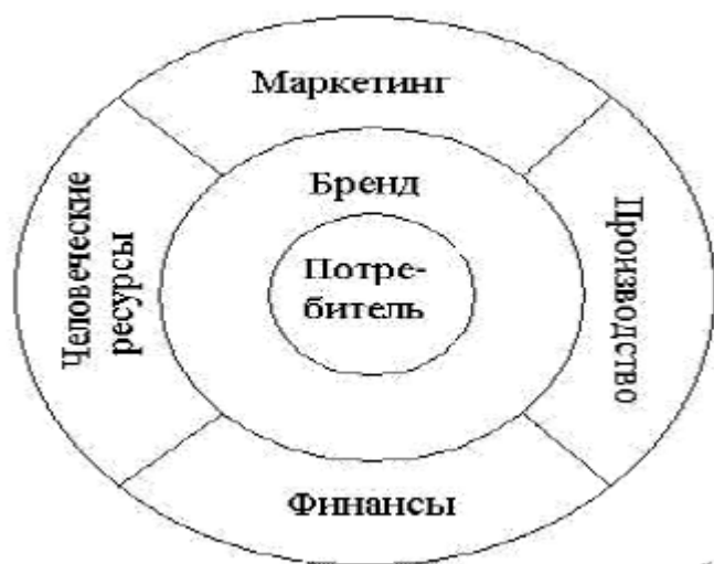
Рис. 1. Модель управления брендом в качестве связующего звена между потребителем и главными составляющими деловой функции компании [7, с. 18]

Брендинг следует рассматривать как процесс, в результате которого создается образ продвигаемого продукта [17, с. 144]. Но, при этом, объектами брендинга могут выступать не только товары или услуги. В современном мире ими становятся идеи, впечатления, имидж, здоровье, красота и т.п. Но, так как ничто не остаётся неизменным, то и бренды вынуждены приспосабливаться к изменяющимся условиям.