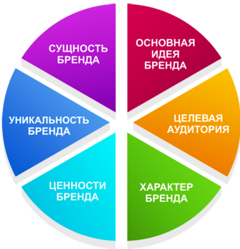
Рис. 1. Элементы бренда