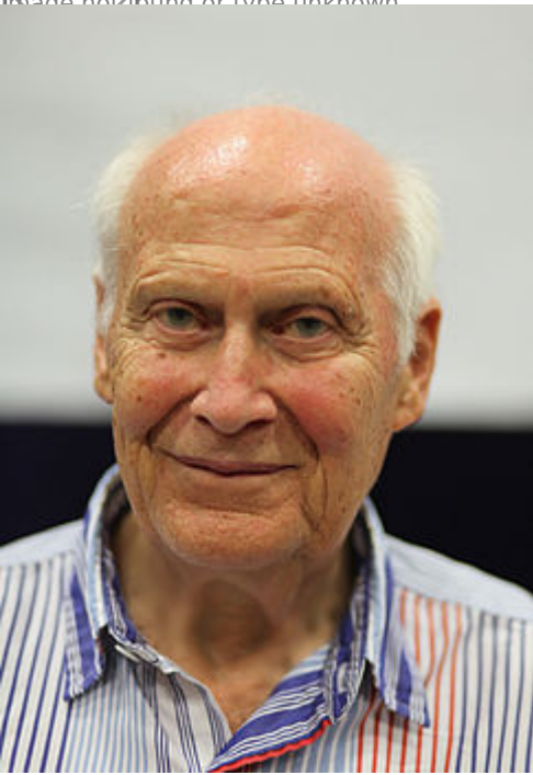
Берт (Антуан) Хеллингер (род. 16 декабря 1925 года,

Лаймен (Баден), Германия) — немецкий философ, психотерапевт и богослов. Широко известен благодаря краткосрочному терапевтическому методу, именуемому — «семейные расстановки».