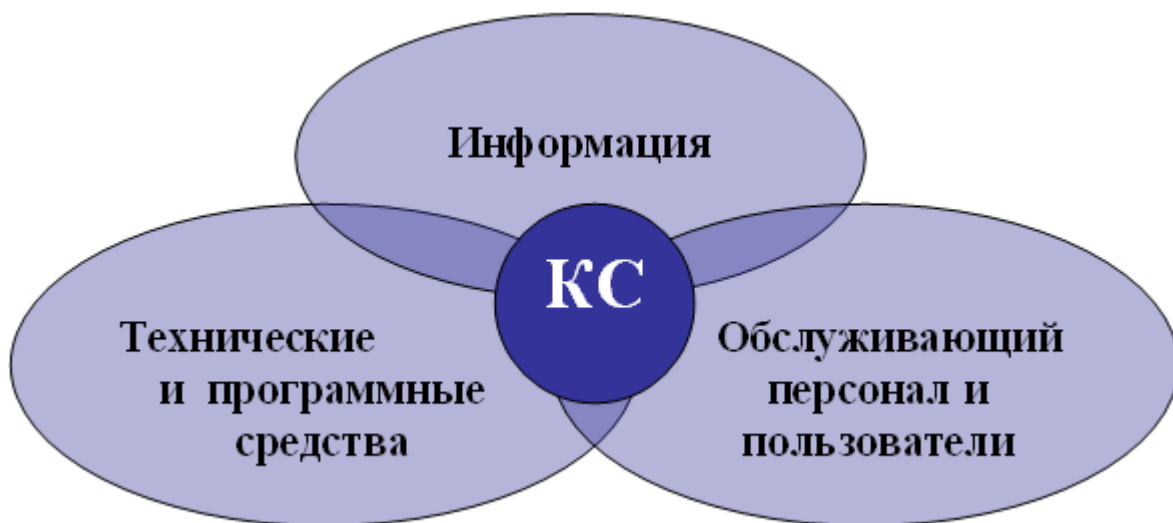
Рис. 1. Компоненты компьютерных систем

Схема данных компонент представлена на рисунке 1.