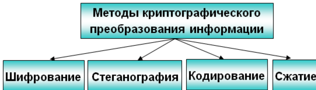
Рис. 4. Методы криптографического преобразования информации

Все традиционные криптографические системы можно подразделить на: