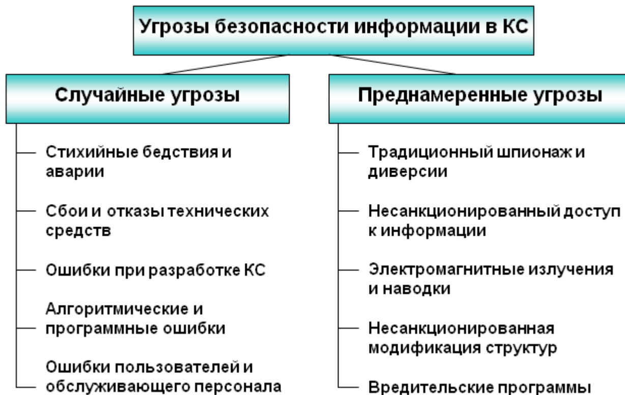
Рис. 2. Угрозы безопасности информации в компьютерных системах

Схематически классификация угроз безопасности информации представлена на рисунке 2.