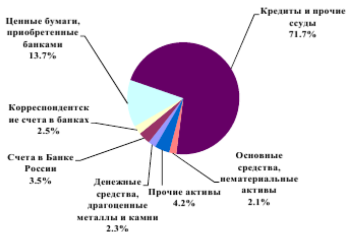
Рисунок 3.2 Структура активов на 1 октября 2014 г.

Во втором квартале розничное кредитование увеличилось на 4,02%, в то время как корпоративное кредитование показало рост на 2,08%. Однако в лидерах за полугодие 2014 г. по росту кредитного портфеля оказался корпоративный (+8,2%), а не розничный портфель (+6,9%). [22] Структура банковских активов на 1 июля 2014 года показана на рисунке 3.2