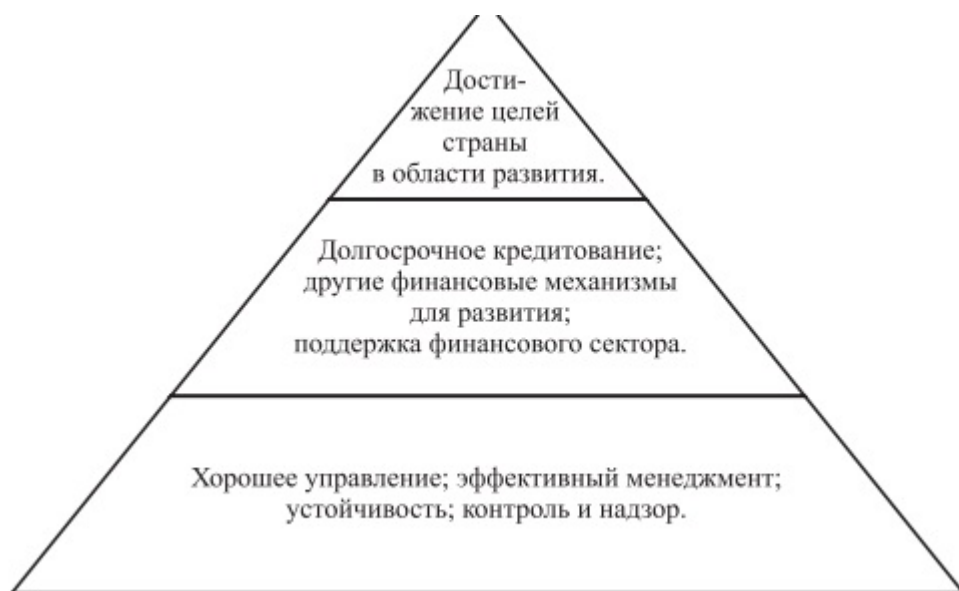
Рисунок 3 - Пирамида деятельности банка развития

Международный опыт показывает, что самыми жизнеспособными банками являются те, которые имеют современную структуру корпоративного управления, систему контроля рисков, компетентные надзорные и управленческие структуры