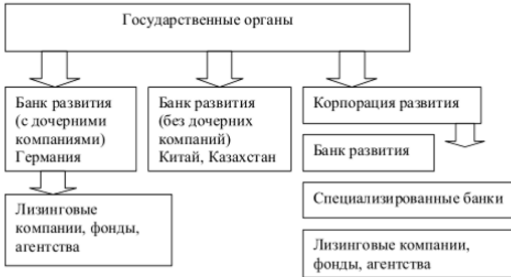
Рисунок 2.3. Национальные институты развития [4]

Банки развития – это специализированные инвестиционно-кредитные институты, организованные в форме госкорпорации или на базе частно-государственного партнерства. От других типов банков их отличает высокая степень капитализации, что позволяет им выполнять масштабные задачи, направленные на решение структурных экономических проблем.