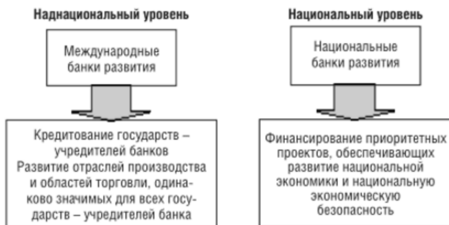
Рисунок 2.4. Банки и корпорации в мире [4]

В большинстве стран такие функции выполняют специализированные кредитно-финансовые институты – так называемые национальные банки (корпорации) развития, сферой деятельности которых является мультипликация государственных инвестиционных ресурсов и их направление в приоритетные отрасли развития экономики, обеспечивающие национальное экономическое развитие и экономическую безопасность (рис. 2.4).