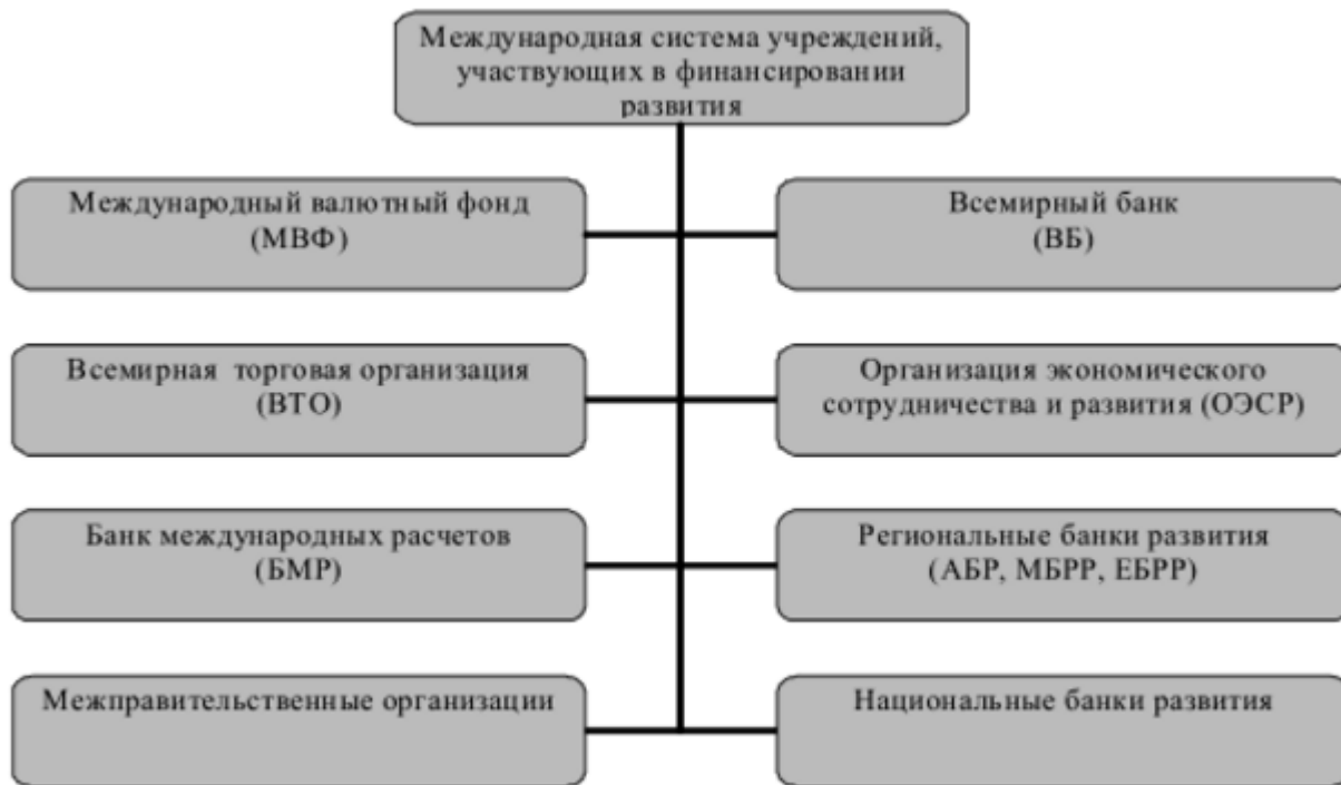
Рисунок 1.1. Международная система учреждений, участвующих в финансировании развития [4]

Существующая структура системы финансовой поддержки на международном, региональном и национальном уровнях – рис. 1.2.