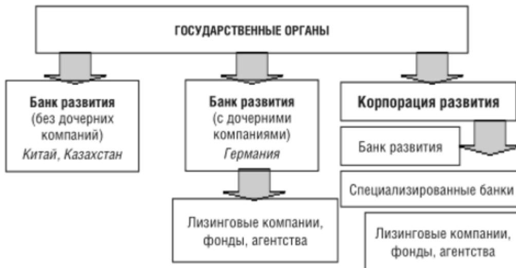
Рисунок 2.5. Варианты национальных институтов развития [4]

Подобные государственные институты играют важную роль в обеспечении роста экономики большинства успешно развивающихся в настоящее время стран мира, например: Государственный банк развития Германии (KfW), Французское агентство развития (ADF), Японский банк развития (DBJ), Институт государственного кредитования Испании (ICO), Китайский банк развития (CDB), Банк развития промышленности Индии (IDBI), Национальный банк экономического и социального развития Бразилии (BDNES).