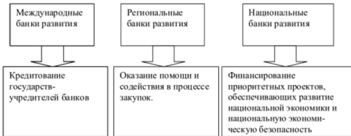
Рисунок 1.2. Структура системы финансовых учреждений развития [4]

Существующая структура системы финансовой поддержки на международном, региональном и национальном уровнях – рис. 1.2.