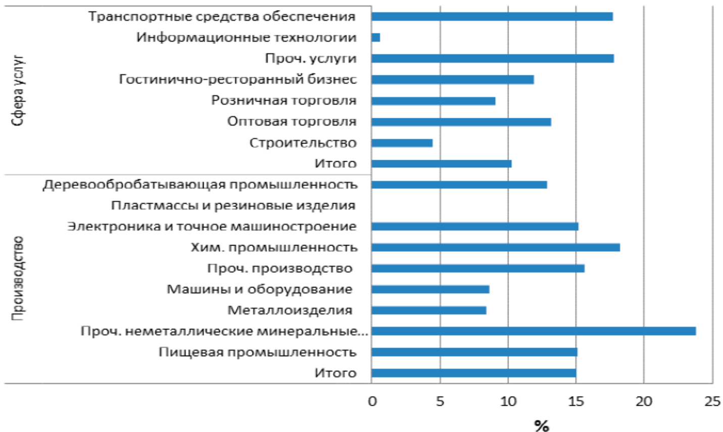
Рисунок 2.1. Доля российских фирм, использующих банковское финансирование инвестиций [13]

По состоянию на 1 января 2016 г. объем средств, направленных Внешэкономбанком на реализацию Программы, составил 56,7 млрд. рублей. Из них 42,1 млрд. рублей – объем портфеля предоставленных дочернему банку долгосрочных кредитов. Указанный объем включает кредит в размере 30,0 млрд. рублей, предоставленный в 2009 году за счет средств Фонда национального благосостояния. В 2015 году данный кредит был пролонгирован на срок до конца 2027 года. Объем средств, доведенных до субъектов МСП в рамках Программы, составил на конец отчетного периода 105,7 млрд. рублей.