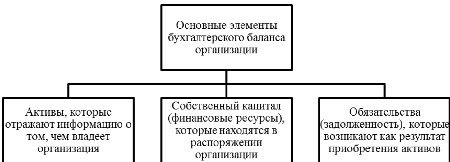
Рис. 1. Основные элементы бухгалтерского баланса организации [4]

Основными элементами бухгалтерского баланса предприятия являются (рис. 1):