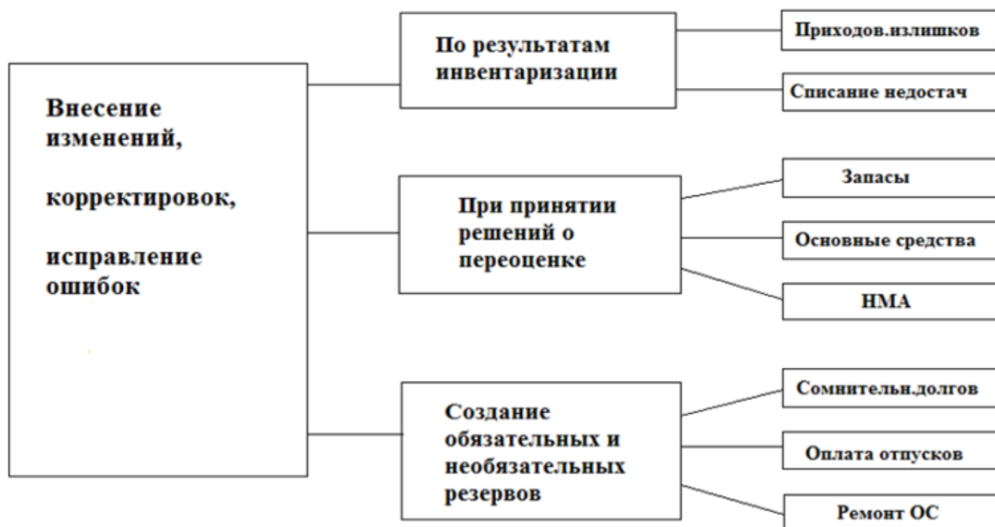
Рисунок 2 - 2 этап составления бухгалтерской отчетности [29]

На 2 этапе вносятся изменения, корректировки, исправляются все выявленные ошибки в учете.