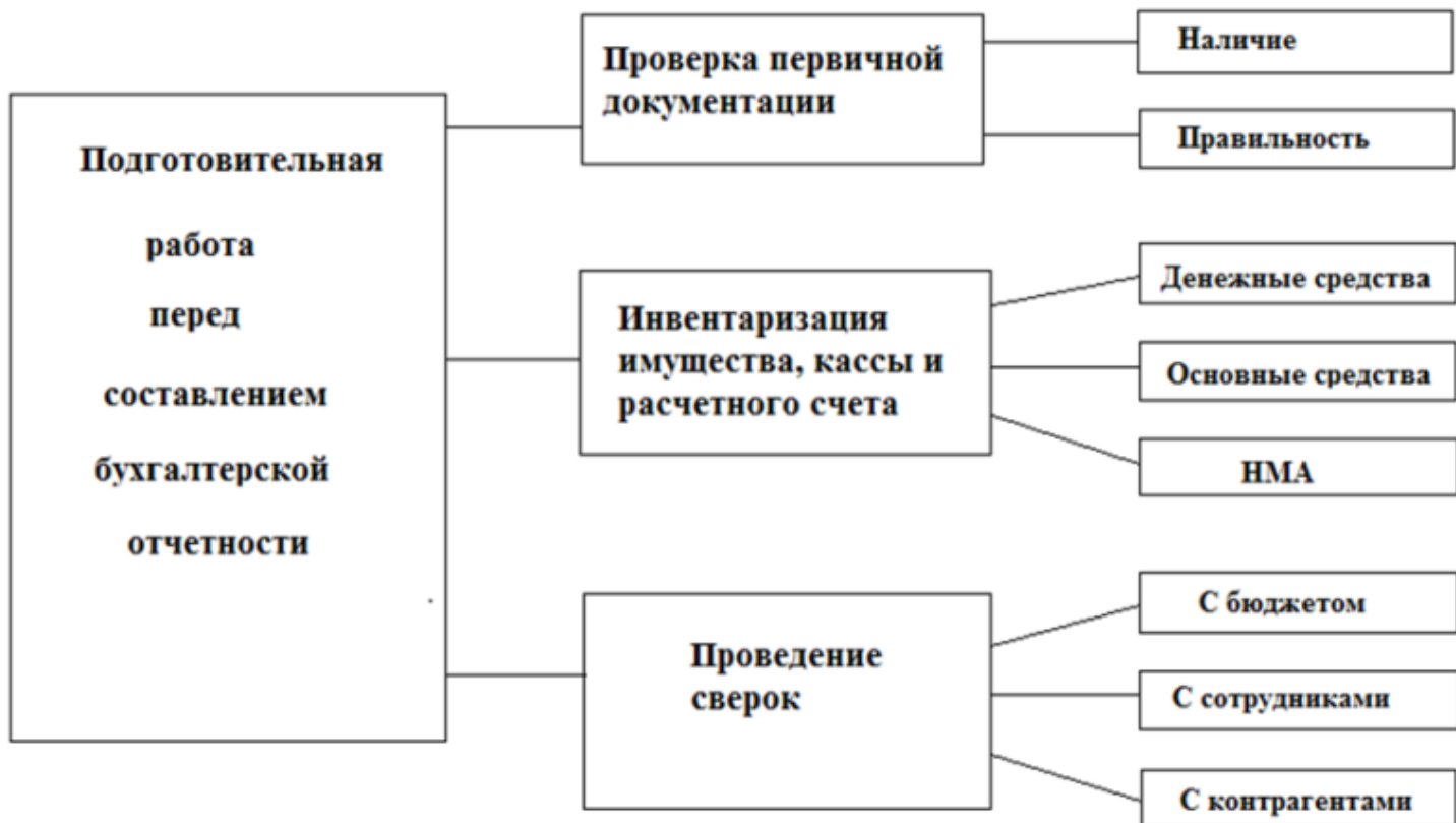
Рисунок 1 - 1 этап составления бухгалтерской отчетности [29]

Т.е. на 1 этапе проводится подготовительная работа. Проверяется вся первичная документация на наличие и правильность составления.