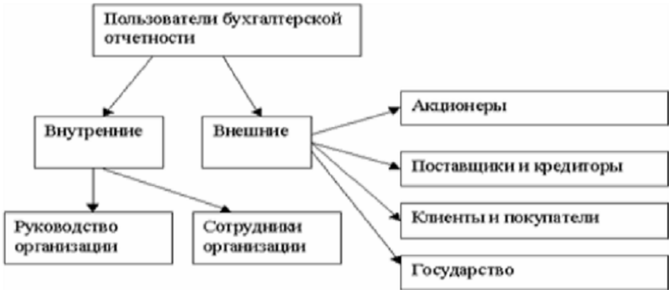
Рисунок 1 - Основные пользователи бухгалтерской отчетности [29]