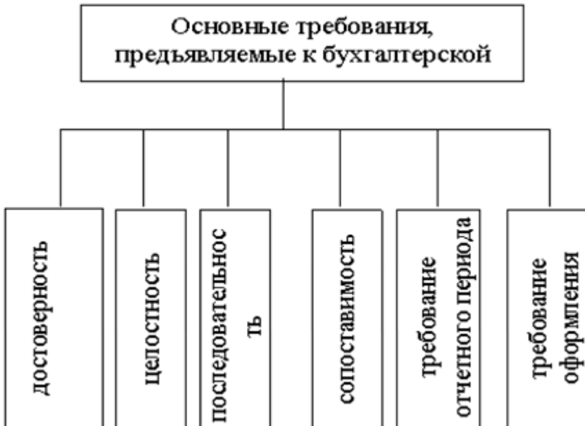
Рисунок 2 - Основные требования, предъявляемые к бухгалтерской отчетности [29]