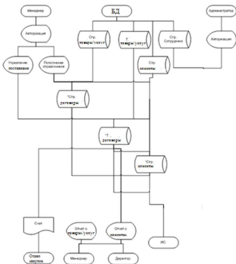
Рисунок 3. Информационная модель

Информационная модель исследуемого бизнес-процесса изображена на рисунке 3.