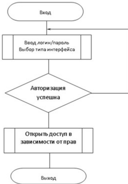
Рисунок 9. Блок-схемы программного модуля

В данном параграфе приведено описание программных модулей на примере модуля безопасности, который осуществляет проверку корректности авторизации пользователей.