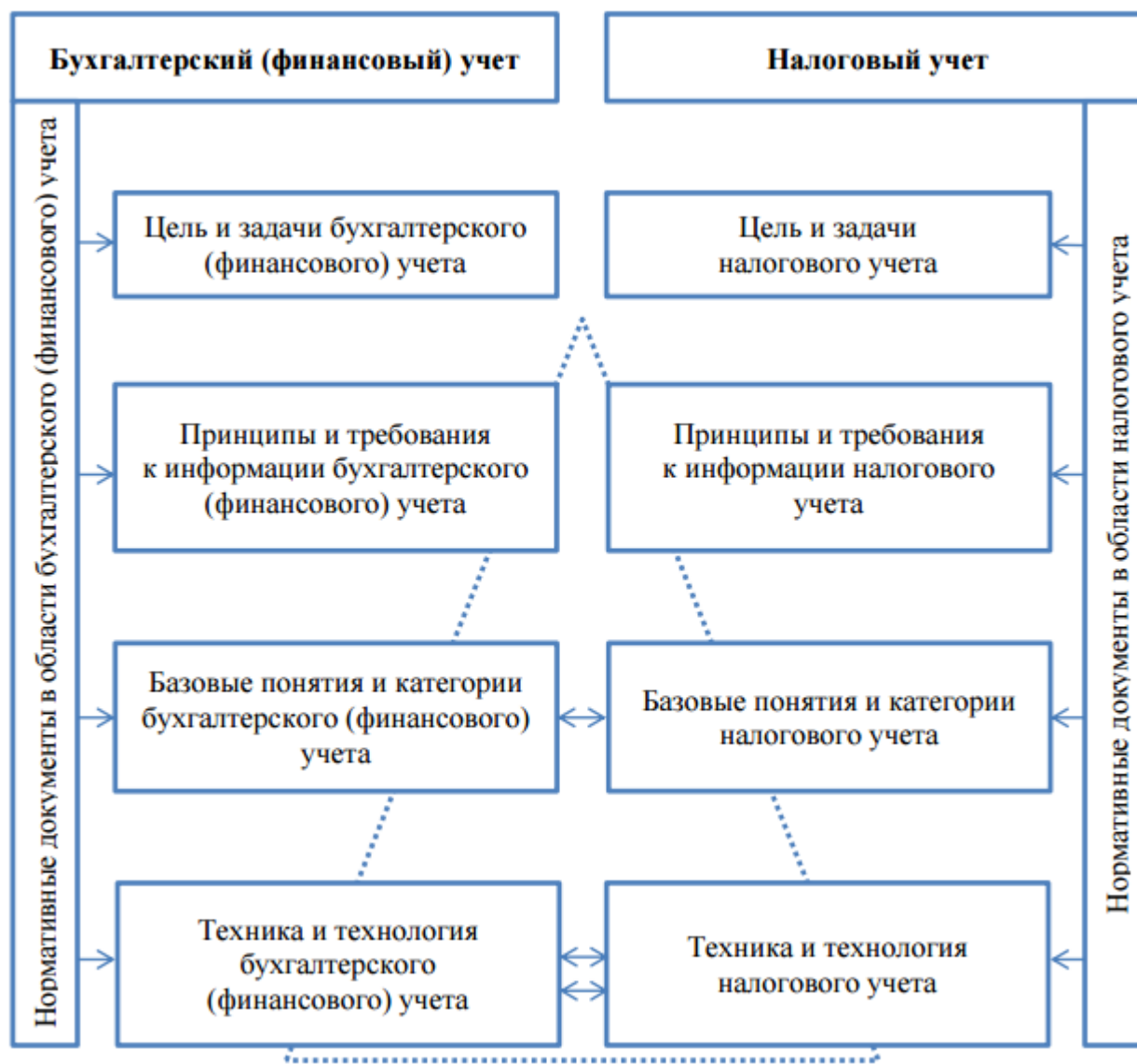
Рис. 3. Взаимосвязь элементов концептуальных основ бухгалтерского и налогового учета[10]

Данные налогового учета должны отражать: порядок формирования суммы доходов и расходов; порядок определения доли расходов, учитываемых для целей