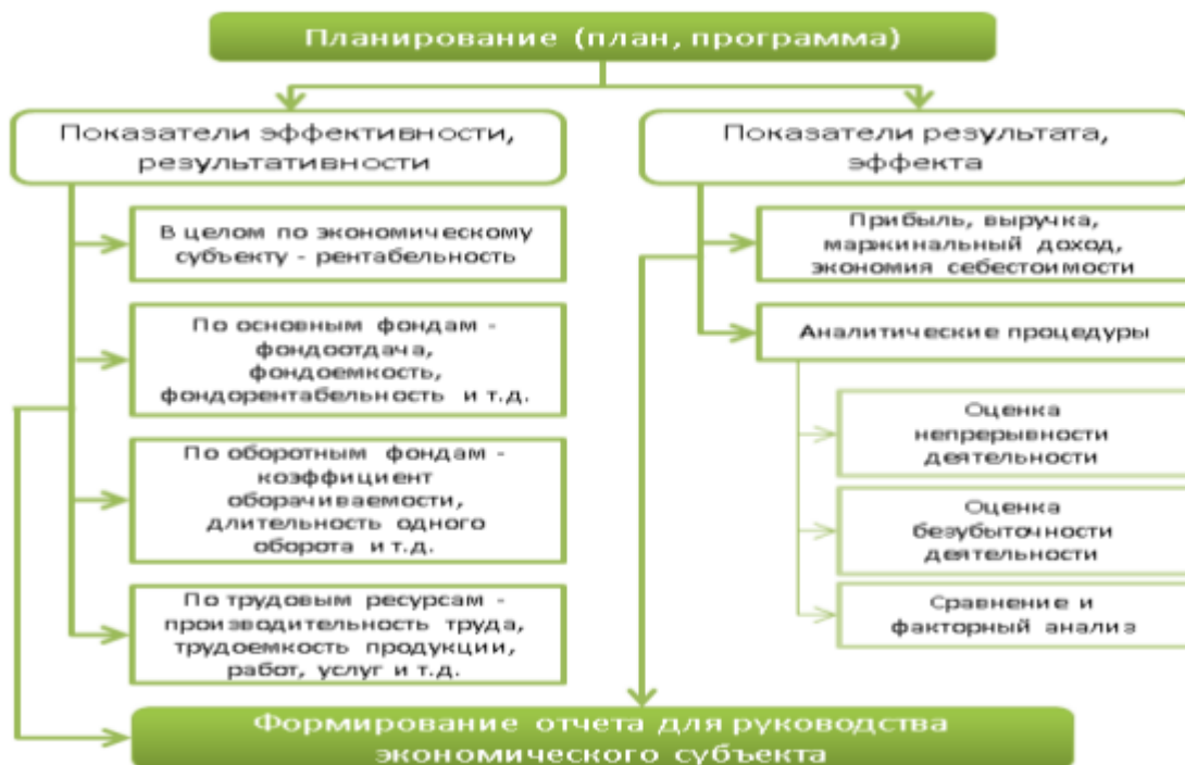
Рисунок 2 - Организация внутреннего контроля [24, с. 15].

Главный принцип организации внутреннего контроля – целесообразность и экономичность. Аудиторское заключение по результатам обязательной аудиторской проверки в составе своей вводной и итоговой частей является открытым документом.