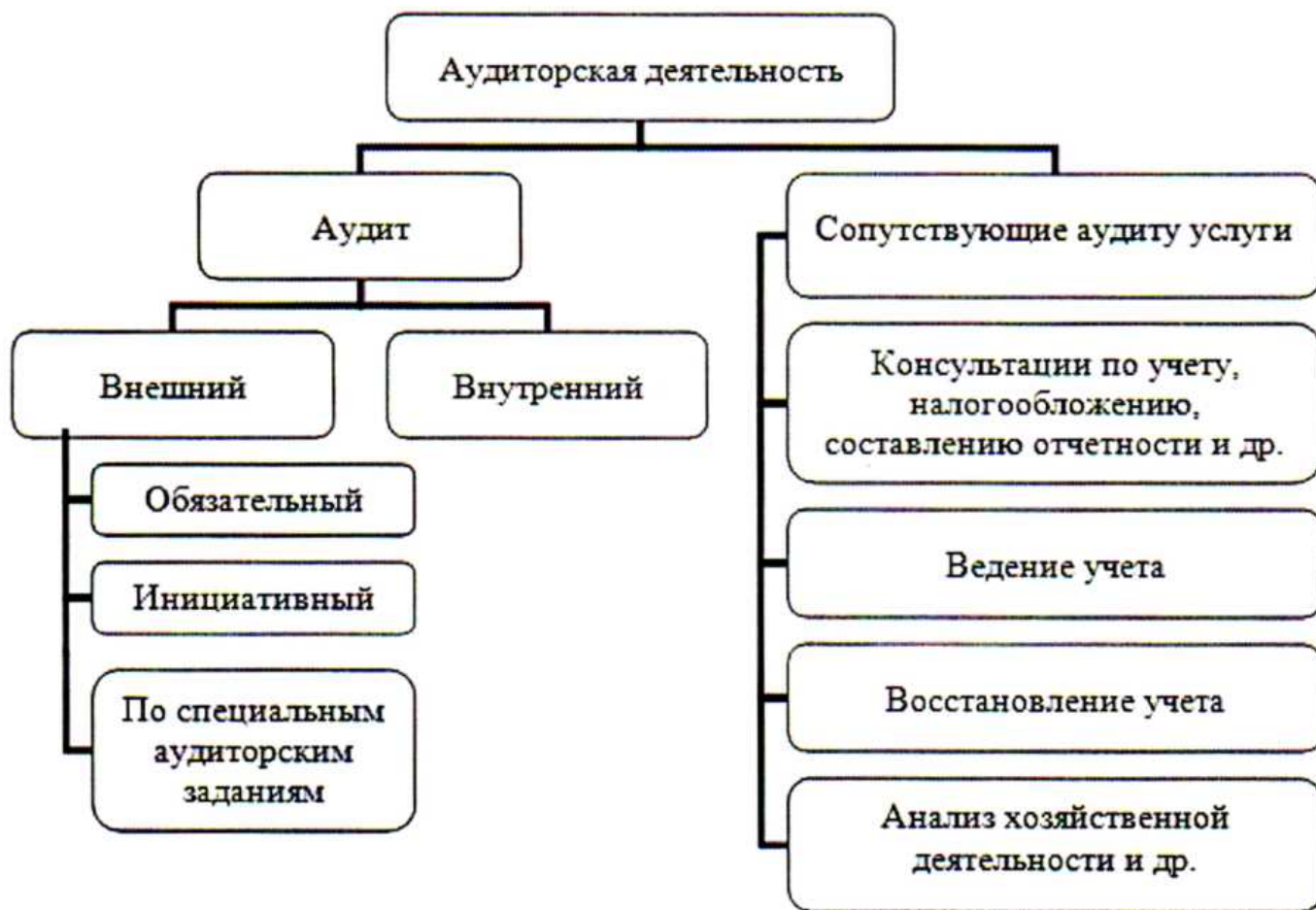
Рисунок 1 - Общая классификация аудиторской деятельности

На рисунке 1 наглядно отражены все виды аудита, которые были рассмотрены в вышеприведенных таблицах. Данные виды структурированы в виде классифицирования аудита.