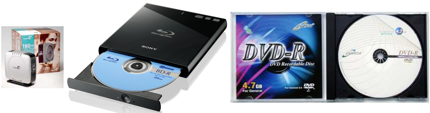
Внешний винчестер Устройство для чтения и записи Blu-Ray дисков