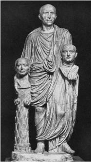
Статуя пожилого римлянина с портретами предков. Рим, Палаццо Барберини

Во времена республики центральной площадью Рима - Форумом, где кипела вся деловая, торговая и политическая жизнь великого города, - было место между холмами Капитолием и Палатином. Здесь размещались основные общественные здания - сенат, суды, архив, тюрьма, главные храмы (в одном из них хранилась казна), трибуна, с которой выступали ораторы. Здесь ставили прижизненные и посмертные статуи прославленным горожанам Рима. Размеры Форума в I в. до н.э. составляли 160 x 80 м, но облик его менялся во времени. Храмы наполнялись греческими скульптурами и другими предметами искусства, вывозимыми завоевателями отовсюду, в основном из городов эллинистического мира. В 55-52 гг. до н.э. на Марсовом поле был построен театр Помпея - уже самостоятельное здание, а не скамьи под открытым небом.