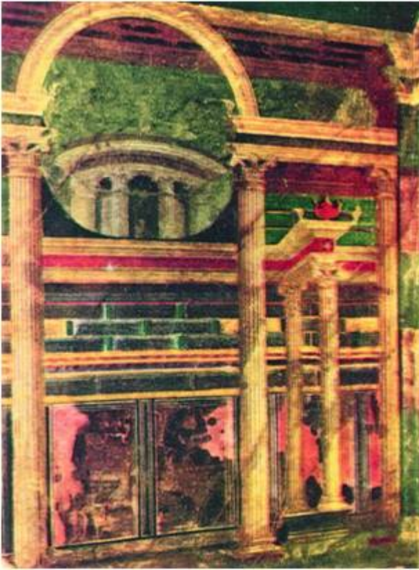
Фреска из Самнитского дома.

Все архитектурные детали (пилястры, карнизы, цоколь, полочки, отдельные квадраты) делались объемными из штукатурки, а потом расписывались.