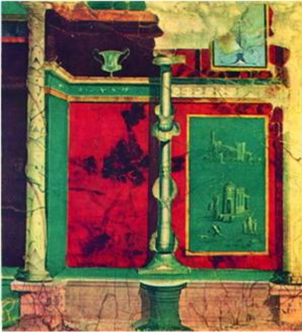
Вилла Мистерий. 60-е гг. до н.э.