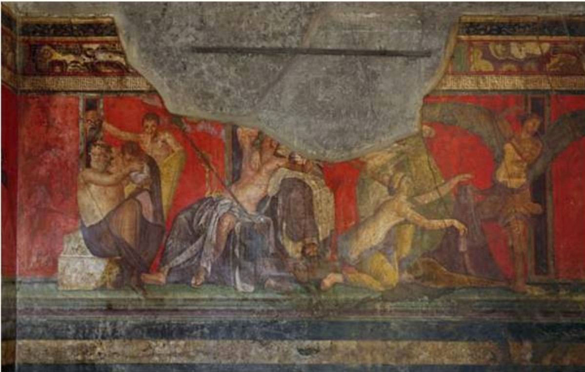
Фреска 2 помпеянского стиля виллы Мистерий. Помпеи.