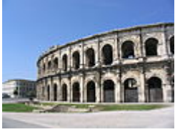
Амфитеатр в Ниме