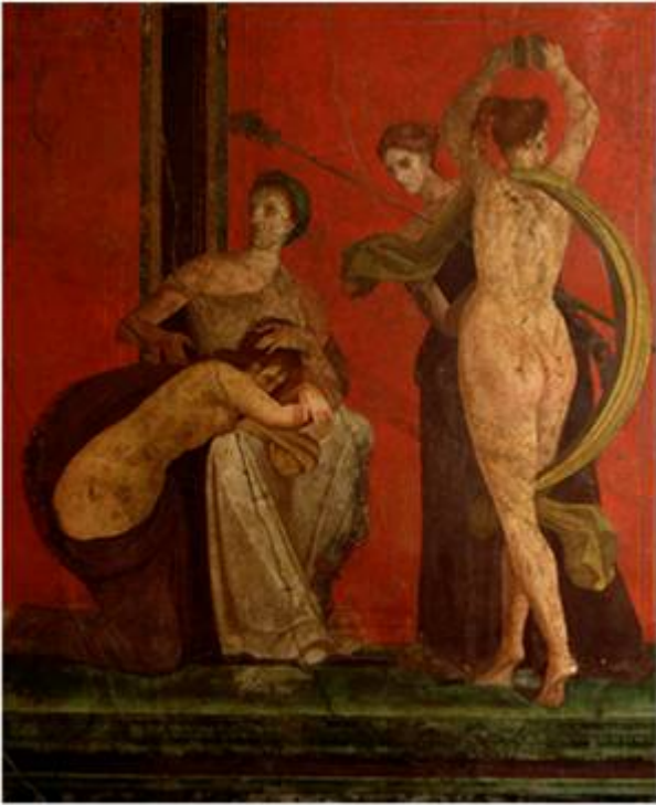
Бичуемая девушка и вакханка. Фрагмент фрески виллы Мистерий. Помпеи.