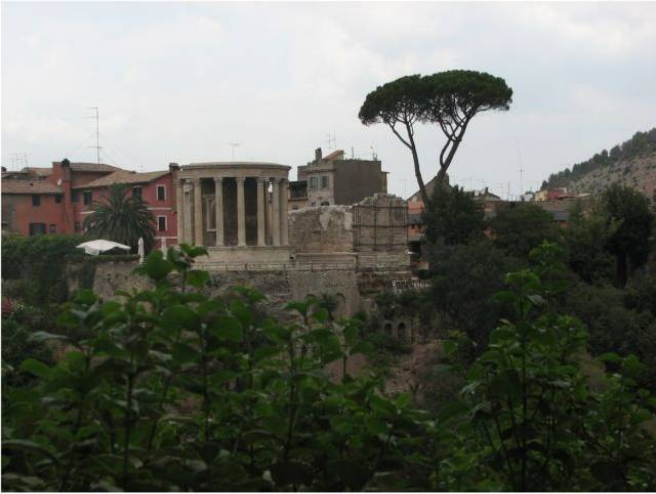
Еще один храм, круглый в плане. Храм Весты в Тиволи. 1 в. до н.э.

В I веке до н. э. инженер и архитектор Витрувий создал трактат "Десять книг об архитектуре", который был подлинной энциклопедией строительной практики его эпохи. Витрувий сформулировал основные требования, которые применимы к архитектурному сооружению любого времени: оно должно сочетать в себе пользу, прочность и красоту. От зодчего Древнего Рима требовалось всеобъемлющее образование, включающее знание климата, почвоведения, минералогии, акустики, гигиены, прикладной астрономии, математики, истории, философии, а также архитектурной эстетики.