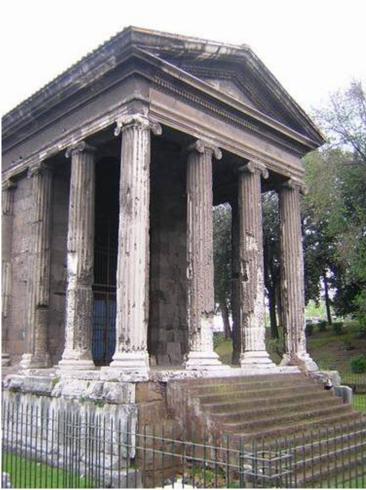
Храм Фортуны Вирилис на Бычьем форуме (рынке). 1 в. до н.э.