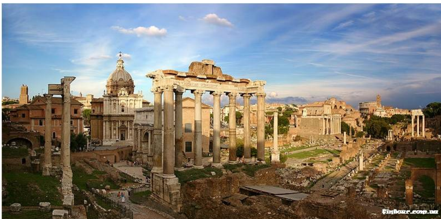
Храм Сатурна на форуме Романум. 1 в. до н.э.

Сооружения времени республиканского Рима свидетельствуют о полном овладении греческими ордерами. В основном сооружения строились из известняка, туфа, частично из мрамора.