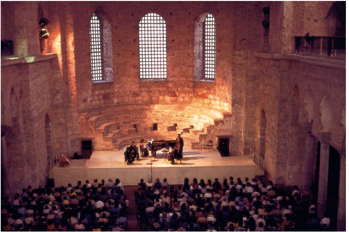
Церковь святой Ирины.