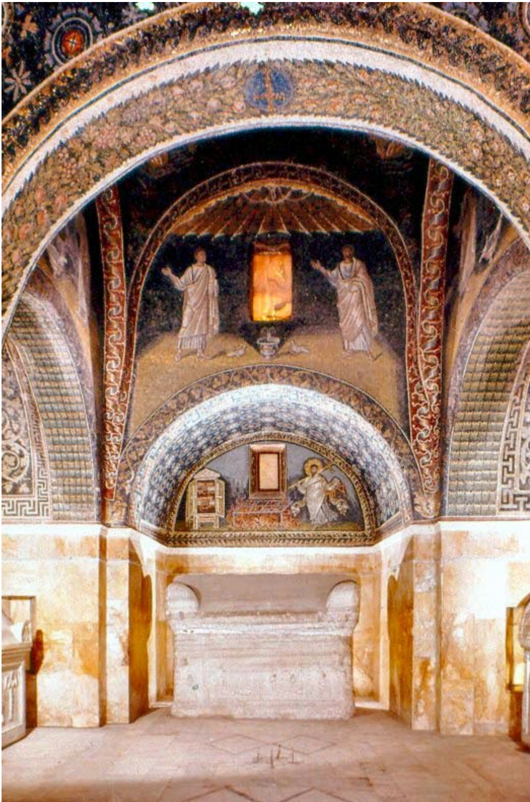
Мавзолей Галлы Плацидди

Под влиянием набегов и культурной экспансии западных христиан, архитектура Византии становилась все более сложной. Возрастает роль декорирования наружного убранства (Церковь Христа Спасителя в Полях, в составе ансамбля