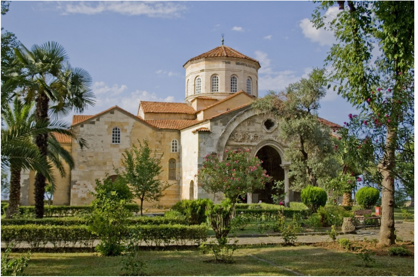
Храм Святой Софии (Трабзон)