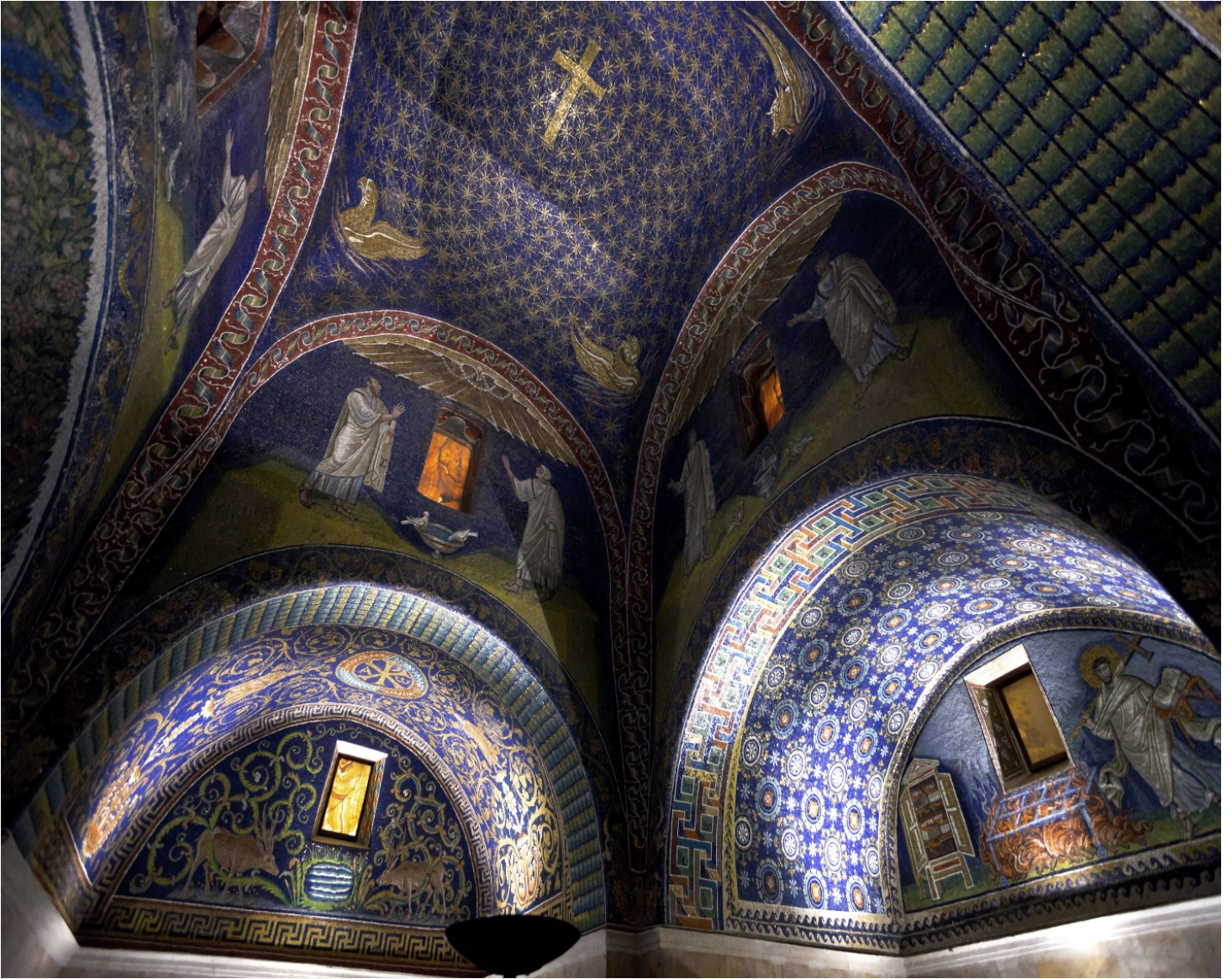
Мавзолей Галлы Плацидди

архитектура других городов — памятники появлялись в Равенне.