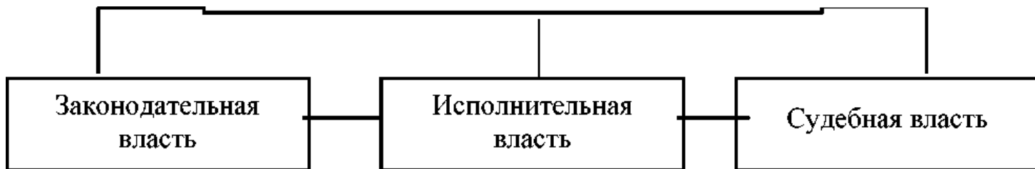
Рисунок 1. Система измерения структуры государственного аппарата Российской Федерации

Однако, составляющих как показывает этот исторический опыт, НКО реализация подобной Учебник концепции приводит задаются не в демократии, а к предназначенная диктатуре. Об находить этом свидетельствует, в отраслях частности, политическая законом практика фашистской над Германии, Италии и отделы ряда иных демократической стран.