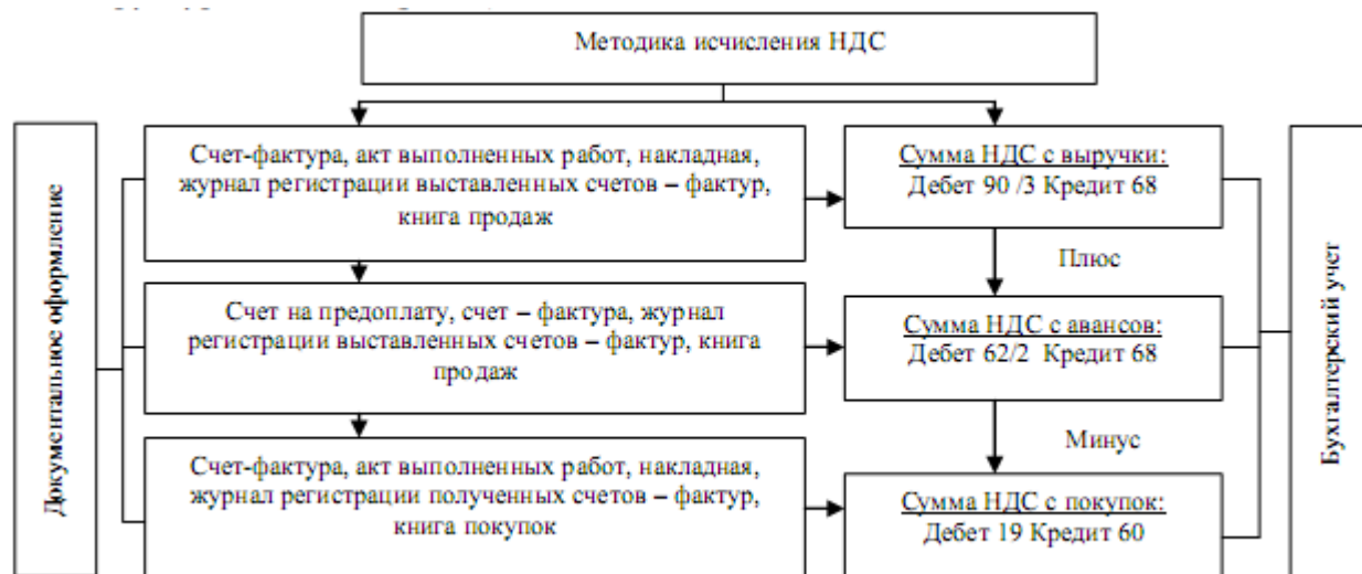
Рисунок 2.1 –Методика исчисления НДС

информационные системы «1С:Бухгалтерия», «Парус», «Налогоплательщик» и другие. Основными задачами применяемой методики является упрощение процесса исчисления налога, экономия времени бухгалтера на проведении расчетов, минимизация налоговых рисков. Методика расчета НДС может быть представлена в виде структурной схемы (рис. 2.1).